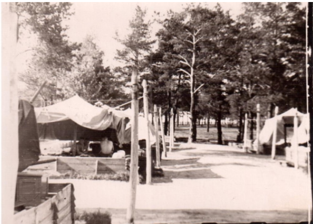
Наша ротная аллея