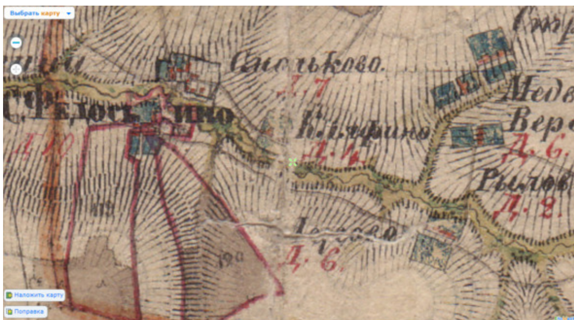
Смольково на карте Менде 1850 года

Печально, что сейчас на месте церкви стоит магазин. Местные жители поставили поклонный крест там, где был вход в церковь.