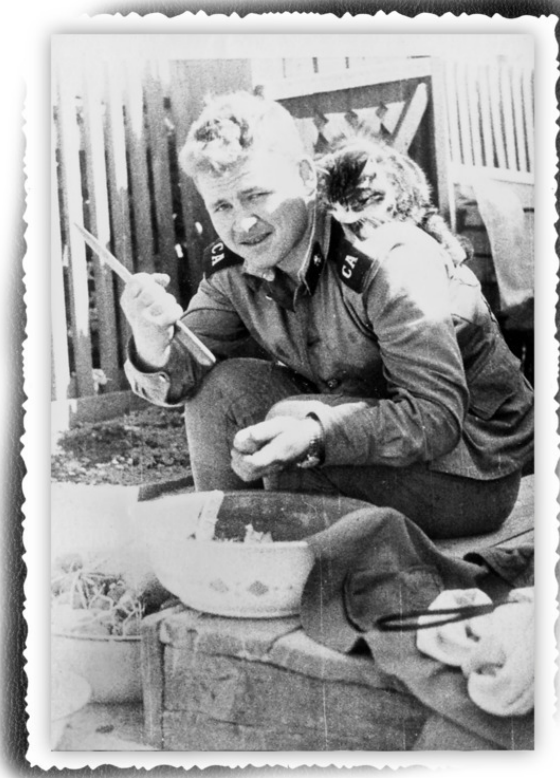
Суп с котом

Дембелям следующего призыва оставалось довольствоваться дичью. На роль дичи были назначены голуби, которых тоже вначале было в избытке. Однако на них охотиться было трудней. Нужно было изрядно попотеть, прежде чем в котелке начинал побулькивать не совсем куриный бульон. Не то чтобы дембелям есть было нечего, просто кураж такой пошел.