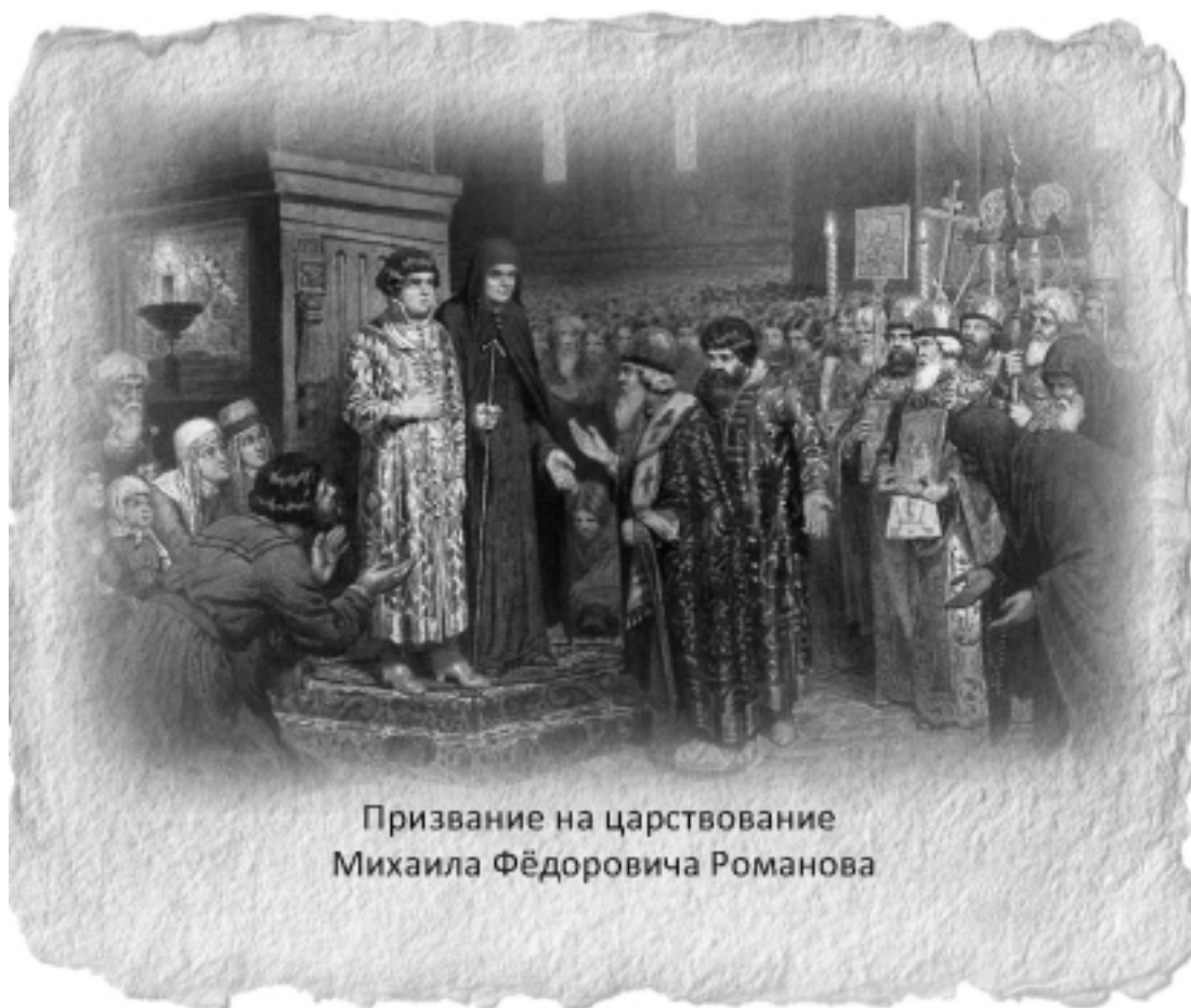
Призвание на царствование Михаила Фёдоровича Романова

Так, не по собственному желанию, но по Воле Божьей и по зову народа, начал царствовать в России Род Романовых.