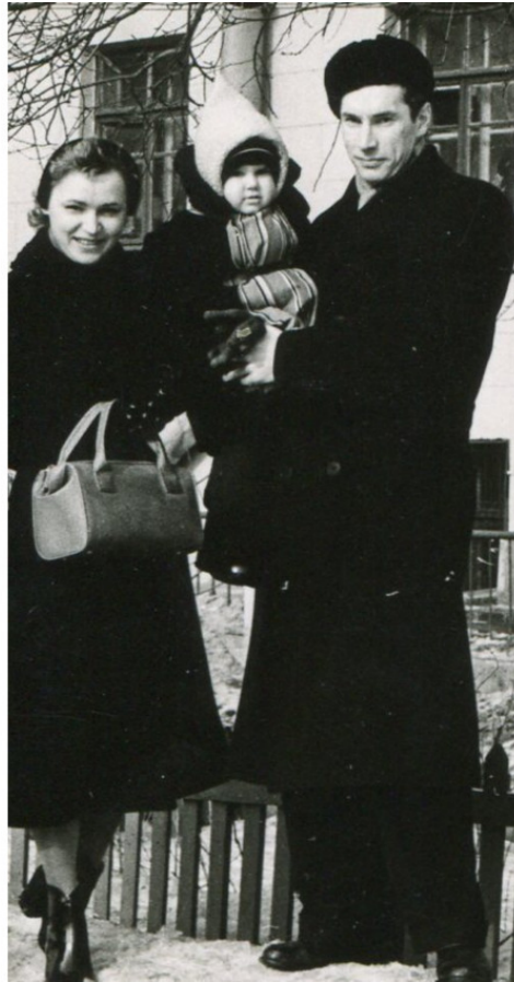
Зима 1960 года Сыну 1 год

Еще танцуя в Большом театре, Игорь Александрович Моисеев начал проявлять себя и как постановщик. Им были поставлен ряд балетов, в том числе «Три толстяка» и «Футболисты». Заинтересовавшись народным творчеством, он начал ставить и народные танцы, а в 1937 году уже основал свой ансамбль.