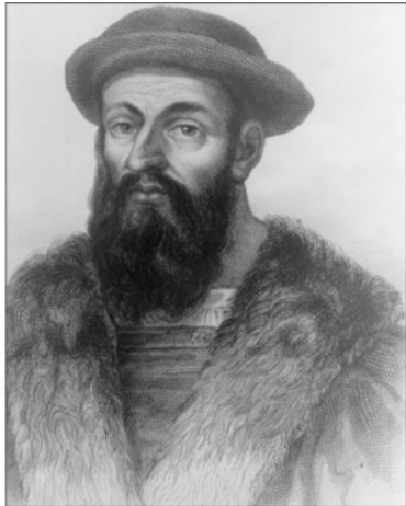
Бартолемеу Диаш..... Фернан Магеллан

Известно, что Диаш слыл опытным мореходом. В составе экспедиций он часто плавал вдоль западного берега Африки. Видимо, поэтому король Жуан, продолжавший дело своего двоюродного деда Генриха Мореплавателя, назначил Диаша командиром флотилии, отправляющуюся для исследования южных берегов Африки и поиска морского пути в Индию.