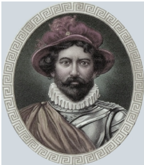
Луис Вазс Де Торрес

ливу Папуа, оставив позади длинный «хвост» Новой Гвинеи. В начале сентября, находясь в излучине залива Папуа, Торрес убедился, что дальше идти вдоль новогвинейского берега нельзя из-за мелей и встречных прибрежных течений. Торрес повернул на юго-запад и повел корабль в открытое море. На 9° и 10° ю. ш. он открыл острова Маланданса, Перрос, Вулкан, Мансерате и Кантаридес – они соответствовали гряде рифов Уорриор (эта цепь рифов тянется через всю северную часть Торресева пролива). Торрес шел к востоку от нее, стремясь обойти рифы и выйти на «чистую воду».