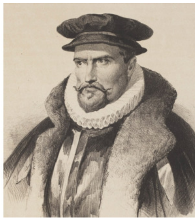
Абель Тасман..... Педро Кирос

Корабли прошли вдоль западного берега до мыса Левин, затем повернул к юго-востоку. Через несколько дней мо-