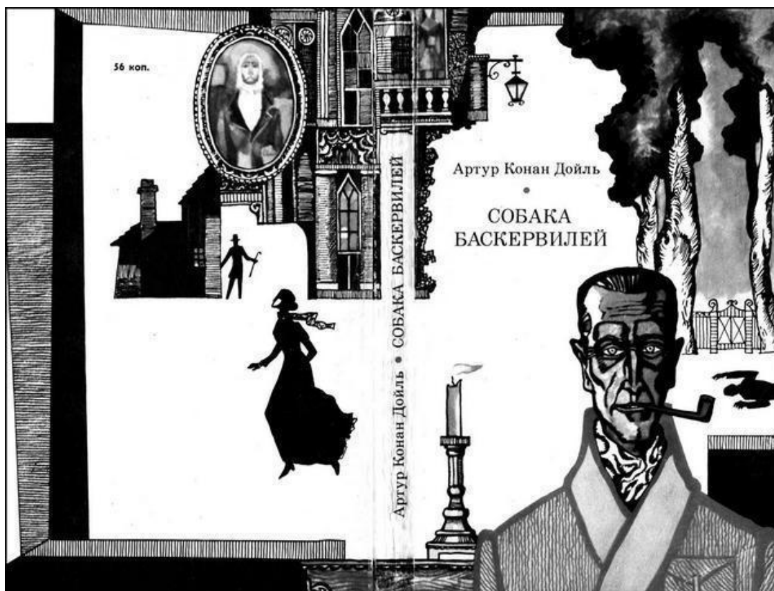
Разворот обложки сборника «Собака Баскервиль»

Да, чуть не забыл. Я ведь, в конце концов, поддался уговорам друзей и всесоюзному ажиотажу, прошёл тогда всю «цепочку» и теперь записал эту историю по собственному опыту и воспоминаниям, являясь счастливым спасителем родной природы и почётным обладателем и «Королевы», и «Собаки». Специально для вас раскопал в своих завалах книжонку любимого сэра Артура, стоившую 56 копеек (цена аж двух батонов хлеба или одиннадцати поездок на метро, или почти двух пачек сигарет «Ява») и множества трудов, мытарств и унижений, чем хочу доказать вам, что я, по роду нашей профессии вынужденный очень часто вырубать деревья и другие «зеленные насаждения» ради красоты кадра, тогда спас несколько веточек , которые, надеюсь, разрослись, по-своему благодарны мне. Обложку, как видите, отсканировав по частям, я старательно собрал воедино, дабы вы смогли в полной мере оценить уровень мастерства художника и степень его «глубины погружения в тему».