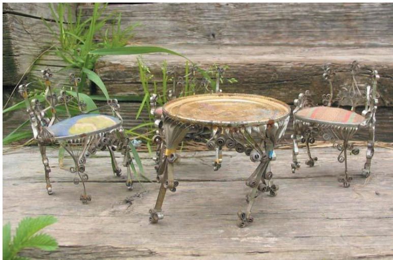
Рис. 4. игрушечные столик и стулья из консервной банки (Вологодская область).

На фотографиях, которые были сделаны в деревнях Вологодской и Архангельской областей, шкатулка, сшитая из старых открыток, игрушечный столик и кресла – из консервной банки.