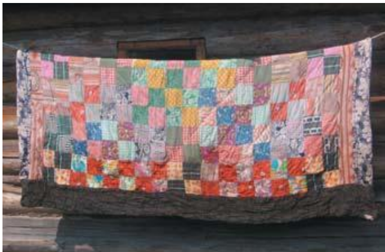
Рис. 2. лоскутное одеяло (Вологодская область).