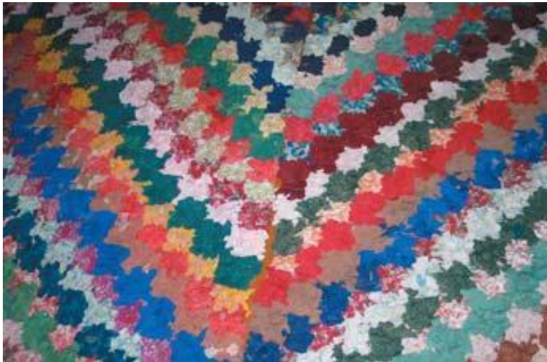
Рис 1. самодельные коврики из обрезков тканей. (Вологодская область).