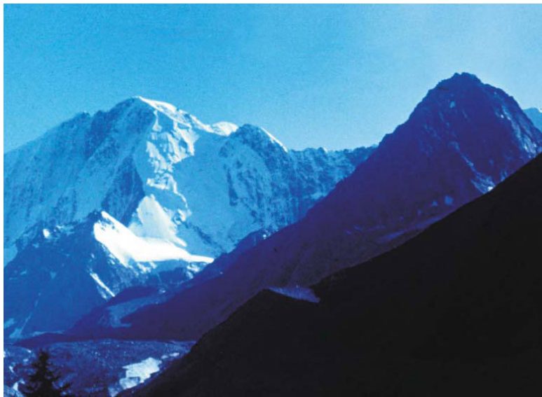
Катунский хребет. Пик Беликова ( справа )