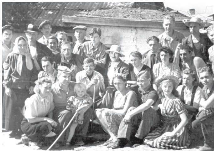
Съемочная группа фильма «Молодая гвардия» с краснодонцами. 1948 г.

Мастерство режиссера и актера театра и кино рождается не из владения какими-то имманентными приемами исполнения, а прежде всего – из глубокого проникновения в жизнь, из знания отображаемой действительности в ее развитии, во всей присущей ей конкретности. Средства воплощения действительности в искусстве актера и режиссера не существуют сами по себе – они рождаются органически из знаний этой действительности. Когда отображаемая действительность оказывается для актера и режиссера полностью понятной как в главных, решающих своих тенденциях, так и в мельчайших своих конкретных проявлениях, тогда режиссерская и актерская техника приобретает ту базу, без которой она ни существовать, ни развиваться не может.