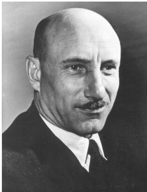
Сергей Аполлинариевич Герасимов (21.05.1906-28.11.1985)