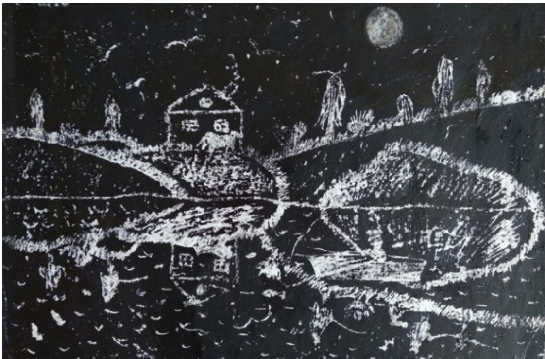
Вечер на озере