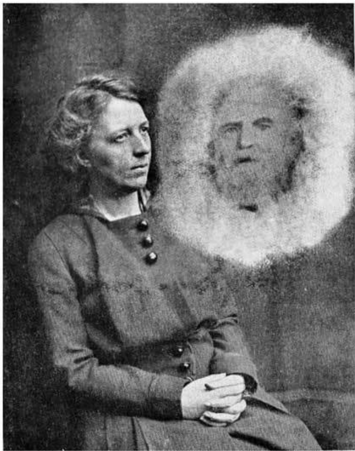
Эстель Стэд с духом отца – Уильяма Томаса Стэда, 1915