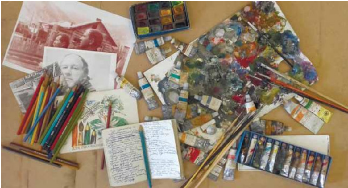
Фото 4. Личные вещи Вадима Елина, подаренные дочерью Марией Елиной Тесинскому художественному музею