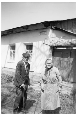
Фото автора, 2003 год.

Дом первопоселенцев Зерновых на Ташкентской 1875 года. Фото автора, 2003 год.