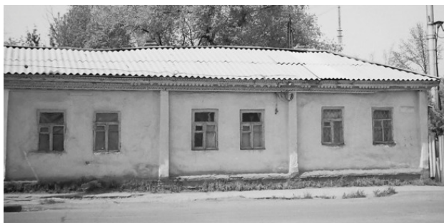
Конно-почтовая станция 1868 года (Ташкентская-Верненская).