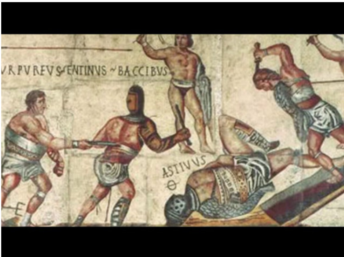
Мозаика с изображением гладиаторов в галерее Боргезе

Рим жаждал зрелищ, Крови на арене! Мучений, криков, смерти, Страданий жутких на арене Жаждал Рим!