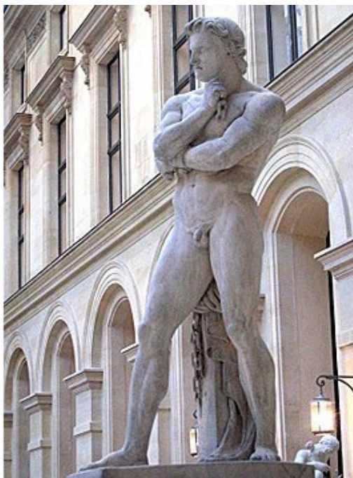
Дени Фуатье Статуя Спартака Мрамор Лувр, Париж

Возможно, сам Спартак служил в армии проконсула Суллы в то время, когда тот начал гражданскую войну против партии Мария в 83 году до н. э. Римляне любили фракийцев, которые имели репутацию отличных кавалеристов, но выступив против Суллы, Спартак попал в плен.