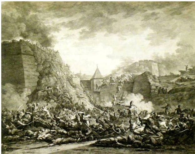
Штурм Очакова. Австрийская гравюра 1792 года