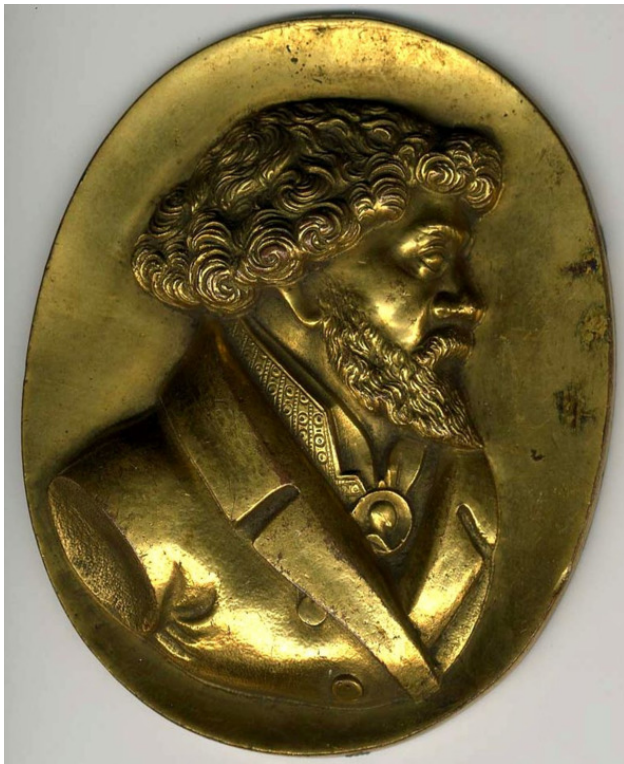
Барельеф-медальон купца Зотова, отлитый на Верх-Исетском заводе в 1820-е годы