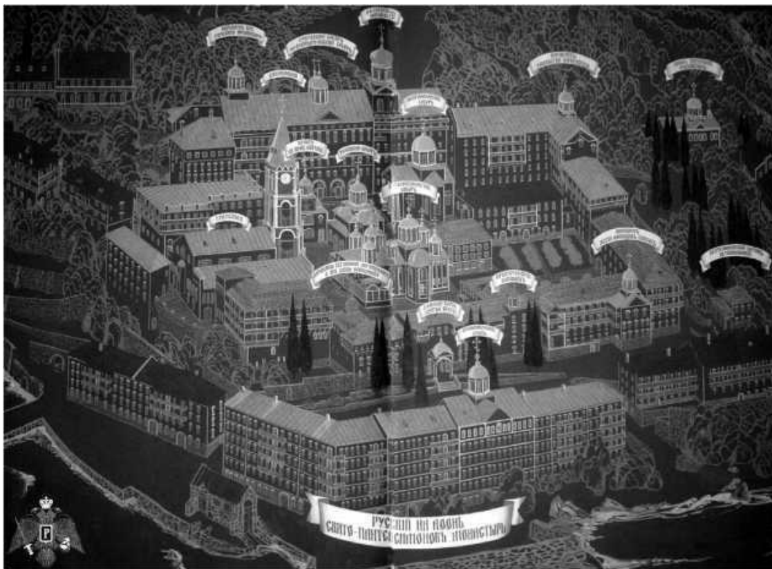
Настенная роспись в Свято-Пантелеимоновском монастыре