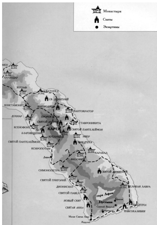
Карта Афонского полуострова

Согласно уставу на Афоне имеется 20 Патриарших ставропигиальных монастырей, из них 17 греческих и три славянских, в том числе русский монастырь св. вмч. Пантелеймона (Руссик). Только эти 20 обителей имеют права собственности на Святой Горе. Помимо монастырей, на Афоне находятся 12 приписанных к ним перечисленных в уставе скитов (не считая заселенных к началу XX в. русскими насельниками скитов Старый Руссик и Новая Фиваида), а также около 200 келлий и 500 калив. Из упомянутых 12 скитов два были русскими – св. ап. Андрея Первозванного и св. прор. Илии.