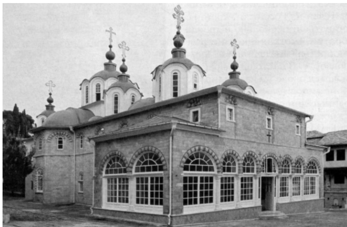
Собор св. вмч. Пантелеймона Свято-Пантелеимоновского монастыря

С середины XIX в. начало быстро расти русское паломничество на Афон. К 1874 г. число русской братии в Свято-Пантелеимоновском монастыре заметно превысило греческую. Престарелый игумен Герасим назначил своим преемником в качестве наместника монастыря русского инока Макария (Сушкина, 1821-1889), прибывшего на Афон в 1851 г., что, правда, вызвало определенное противодействие греческой части братии. В мирном разрешении ситуации важную роль сыграл главный ктитор монастыря – известный во второй половине XIX в. российский государственный деятель и дипломат граф Николай Павлович Игнатъев (боярин Николай и в настоящее время во время молитвы поминается как главный ктитор обители). Его приезд в монастырь в июле 1874 г. во время возмущения греческих насельников имел большой резонанс. Этот визит стал очень важной моральной поддержкой русских монахов в критический период жизни обители 73 . Заступничество графа сыграло решающую роль в принятии Константинопольским Патриархом Иоакимом II в 1875 г. решения поддержать избрание большей частью братии игуменом Свято-Пантелеимоновского монастыря о. Макария. С этого времени обитель снова перешла в руки русских иноков, хотя в ней по-прежнему жили насельники-греки, для которых служба в старом соборе совершалась на греческом языке.