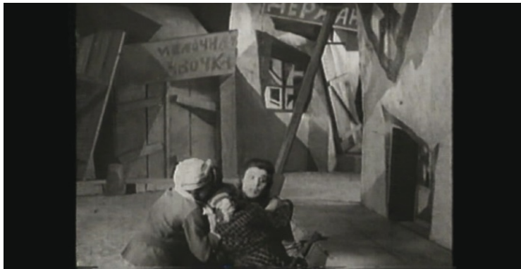
Кадры из фильма "Раскольников", 1923, Германия. Реж. Р. Вине.