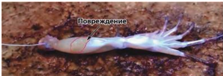
Рис. 2. Надрез на мышце