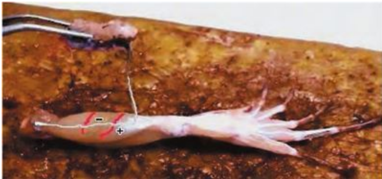
Рис. 3. Нерв наброшен на мышцу (объяснение в тексте)

Этот опыт называют вторым опытом Гальвани, или опытом без металла, поскольку ему предшествовал первый вариант опыта, в котором сокращение происходит, когда лапки лягушки, подвешенные на медном крючке, прикасаются к железной пластинке. В этом случае цепь из разнородных металлов, разделенных раствором электролита, образует источник постоянного тока (гальванический элемент). Л. Гальвани потратил несколько лет, чтобы изменить опыт и доказать наличие «животного электричества». Естественно, научно объяснить это явление 200 лет назад было невозможно.