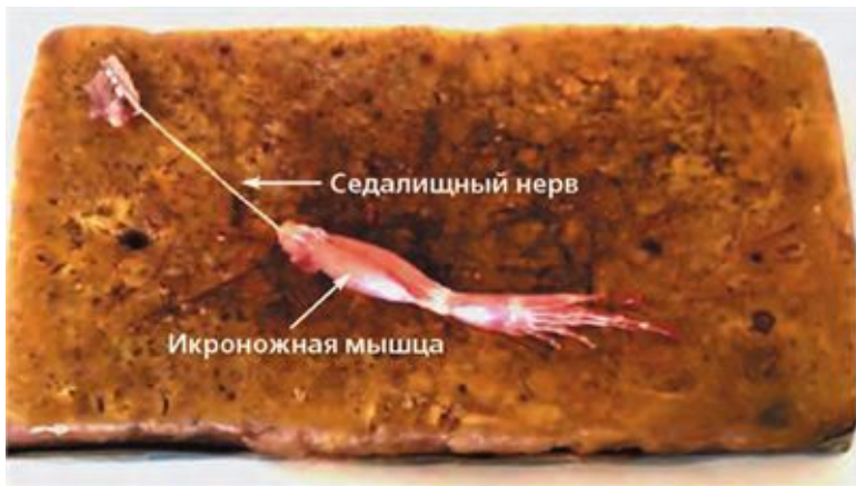
Рис. 1. Препарат из задней лапки лягушки