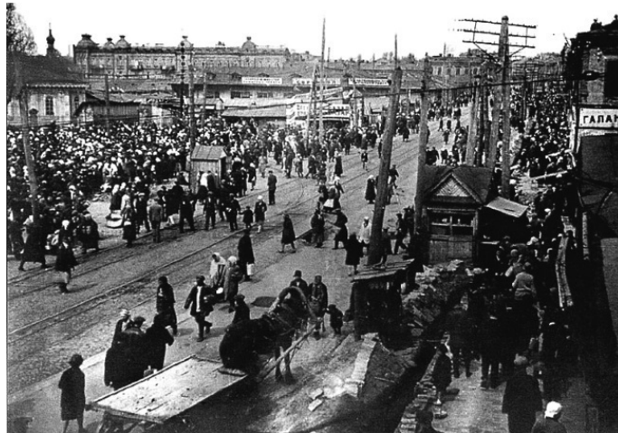
Евбаз. Начало 1920-х

«Что означает слово Евбаз для нынешнего поколения киевлян?»