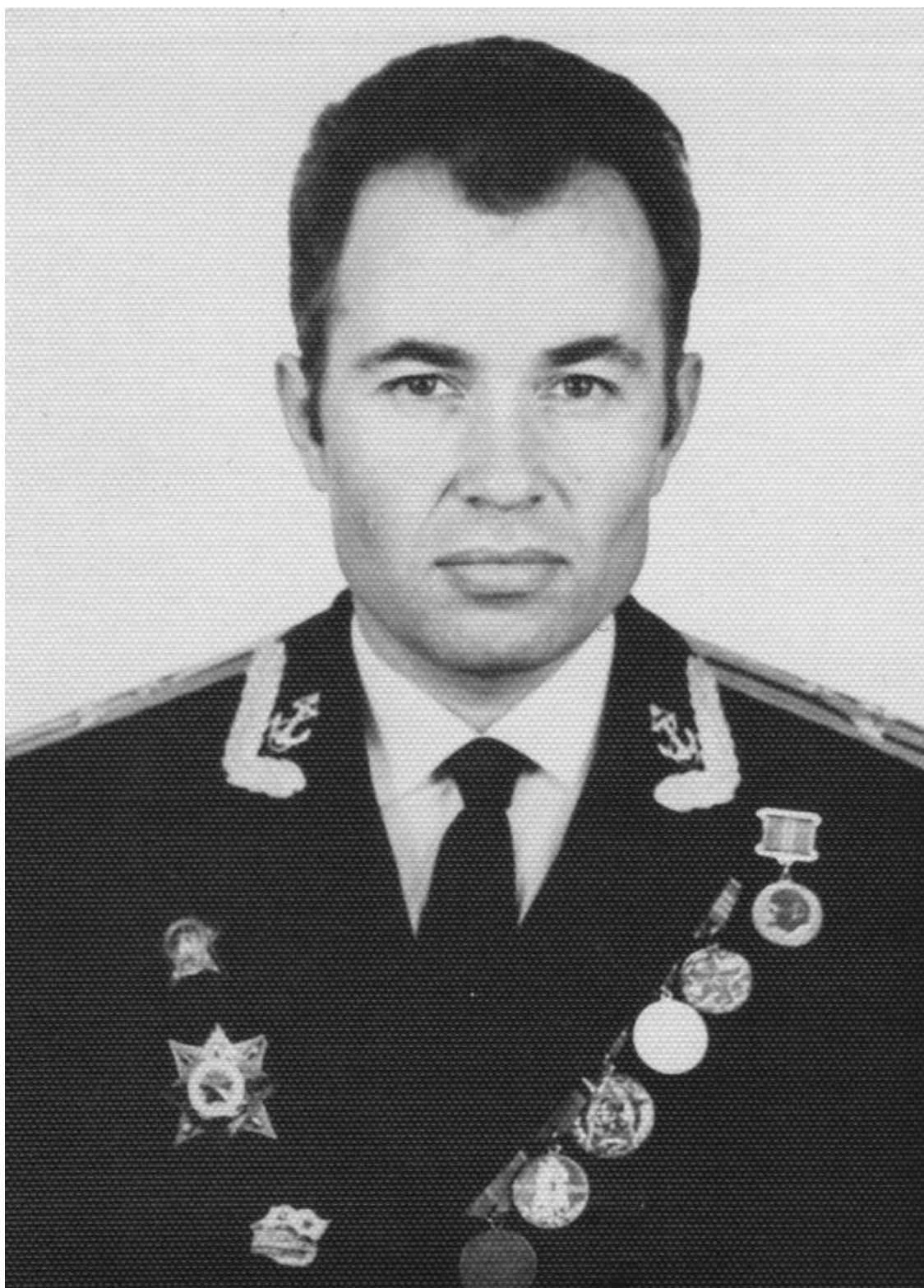
Посвящается памяти о погибших и живым морякам-подводникам А.В.Козинский (2011г.)