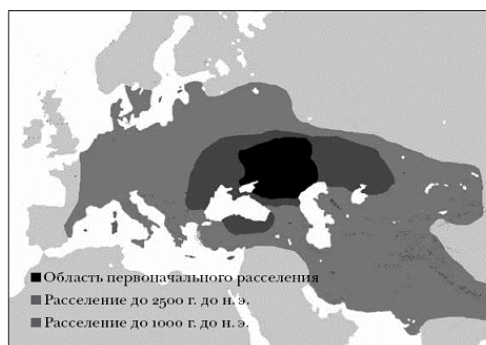
Рис. 1.2. Территориальная экспансия индоевропейских племен. 120

Здесь показана лишь область плотного расселения племен, но не отмечены территории, на которых арии политически господствовали, находясь в меньшинстве.