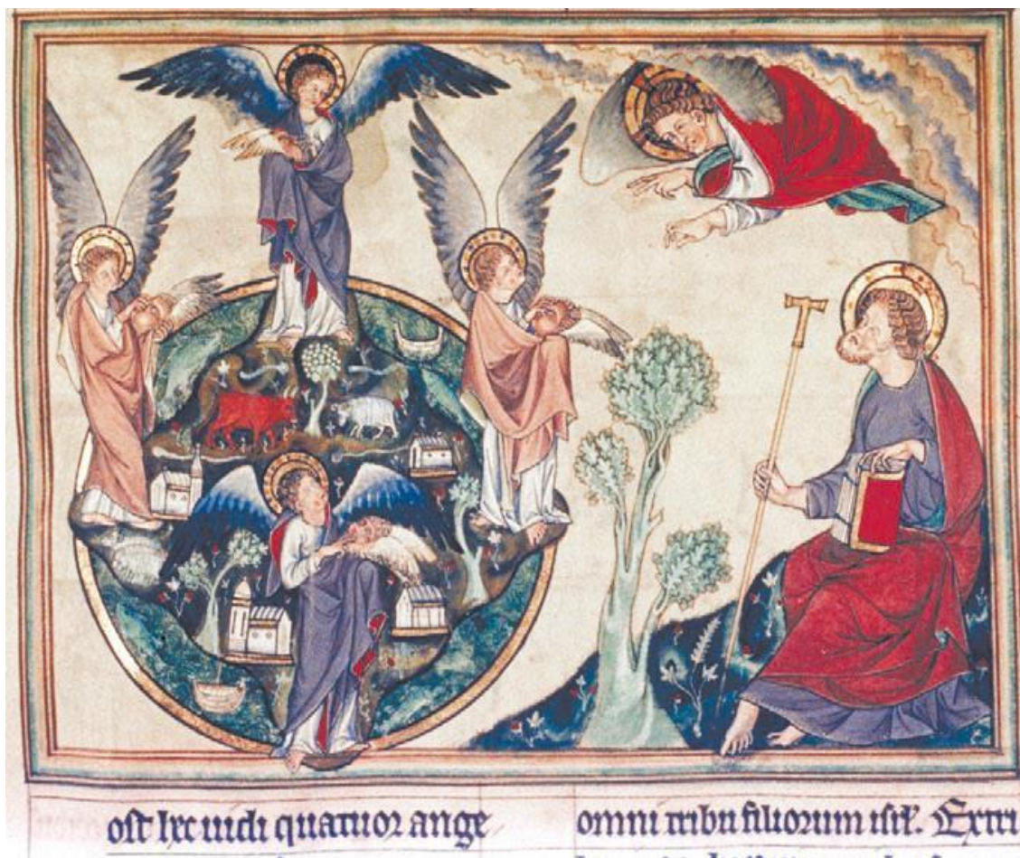
Рис. 14. Четыре ангела держат ветра, изображённые в виде крылатых масок (Откр. 7:1–3). Oxford. Bodleian Library. Douce 180, fol. 19.