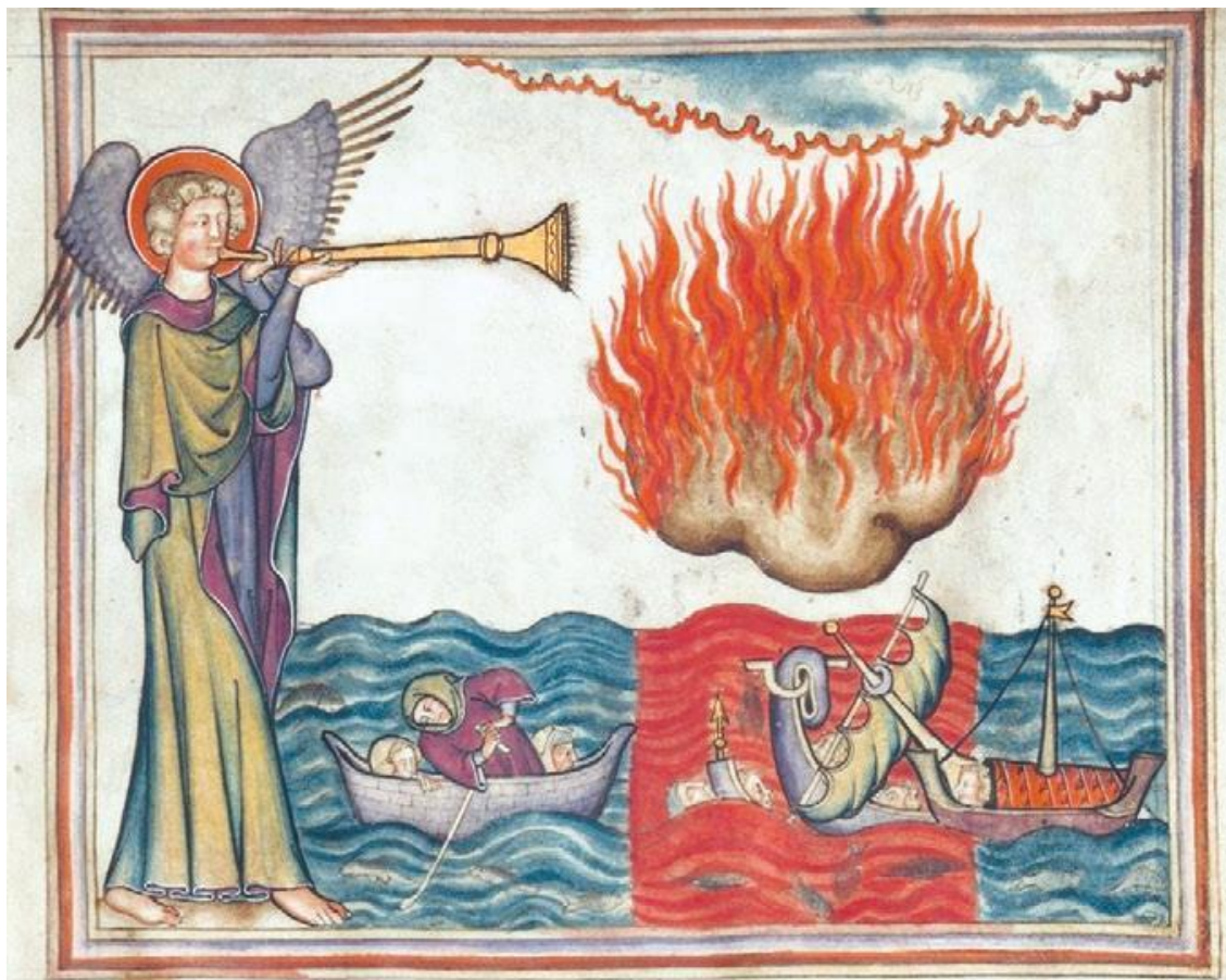
Рис. 15. Ангел низвергает на землю кадильницу, наполненную огнём жертвенника. Художник изобразил и глас первой трубы: град и огонь, смешанные с кровью, обрушились на землю; третья часть деревьев и трав сгорела (Откр. 8:5–7). Oxford. Bodleian Library. MS. Canon. Bibl. Lat. 62, fol. Or.