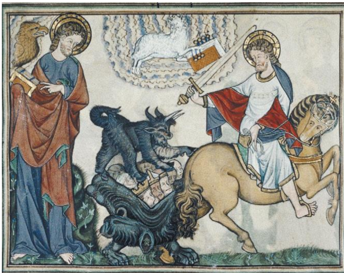
Рис. 11 .На миниатюре английского Апокалипсиса XII в. – всадник на бледном коне с разящим мечом, не упомянутым в тексте Откровения. За ним лохматый чёрт с рогами козла, ушами осла, копытами и хвостом, завершающим хищной пастью волка запихивает мирских грешников в львиный зев ада. Oxford. Bodleian Library. Douce 180, fol. 16.