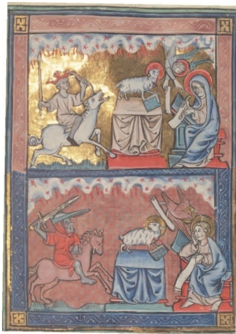
Рис. 7. Миниатюра изображает Агнца на престоле, снимающего печати и выпускающего всадников – специфическое воинство Господне: на белом коне – увенчанный королевской короной наездник с луком, а на рыжем (красном) – скачет воин, разящий мечом. Справа Иоанн фиксирует Откровение. Франция, конец XIII в. Paris. Bibliothèque nationale de France. FR. 13096, fol. 16r.

Агнец начинает снимать печати с книги, и после снятия каждой из первых четырёх печатей тетраморфы восклицают Иоанну – « иди и смотри », знаменуя поочерёдное появление апокалиптических всадников. Сняв первую печать, Агнец выпускает всадника с луком на белом коне. Сняв вторую печать появляется другой конь, рыжий; и сидящему на нём дано взять мир с земли, чтобы люди убивали друг друга; и дан ему был большой меч. За снятием третьей печати следует конь вороной, и на нём всадник, имеющий меру в руке своей. Сняв четвертую печать появился конь бледный, и на нём всадник, которому имя «смерть»; и ад следовал за ним; и дана ему власть над четвертою частью земли – умерщвлять мечом и голодом, и мором, и зверями земными. Снятие пятой печати обнаруживает под жертвенником души убиенных за слово Божие и за свидетельство, которое они имели (6:2–9).