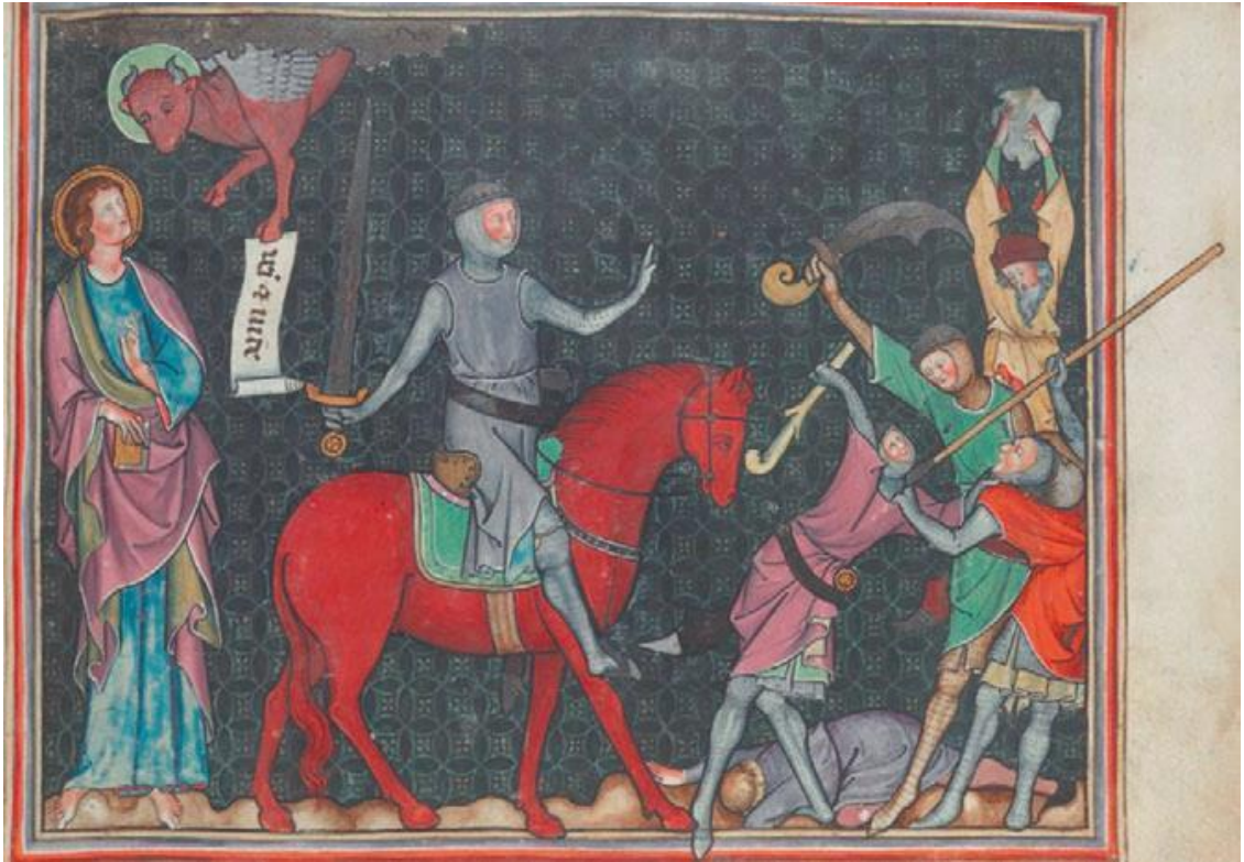
Рис. 8. Второе животное (телец) даёт послание «взять мир», и на рыжем (красном) коне выезжает всадник, облачённый в доспехи, кольчугу. Он несёт войну и раздор: люди поби- вают друг друга. Апокалипсис с комментариями Беренгадуса. Англия, 1320–1330. London. British Library. Add MS 17333, fol. 6r.