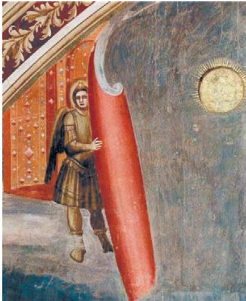
Рис. 13. На фреске знаменитой капеллы Скровеньи Джотто изобразил ангела, сворачивающего небо будто свиток (Откр. 6:14). Джотто, фрагмент из Страшного суда, начало XIV в., Италия, Падуя.