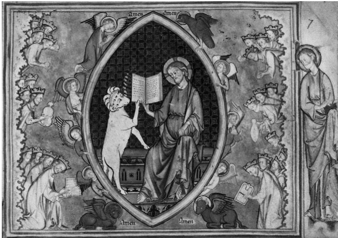
Рис. 5. Иоанн видит Агнца с семью очами и семью рогами, раскрывающего книгу за семью печатями (Откр. 4–5). Центральная композиция окружена четырьмя живыми существами и музицирующими старцами, падающими ниц. Франция, конец XIII в. Paris. Bibliothèque nationale de France. Lat. 14410, fol. 7v.