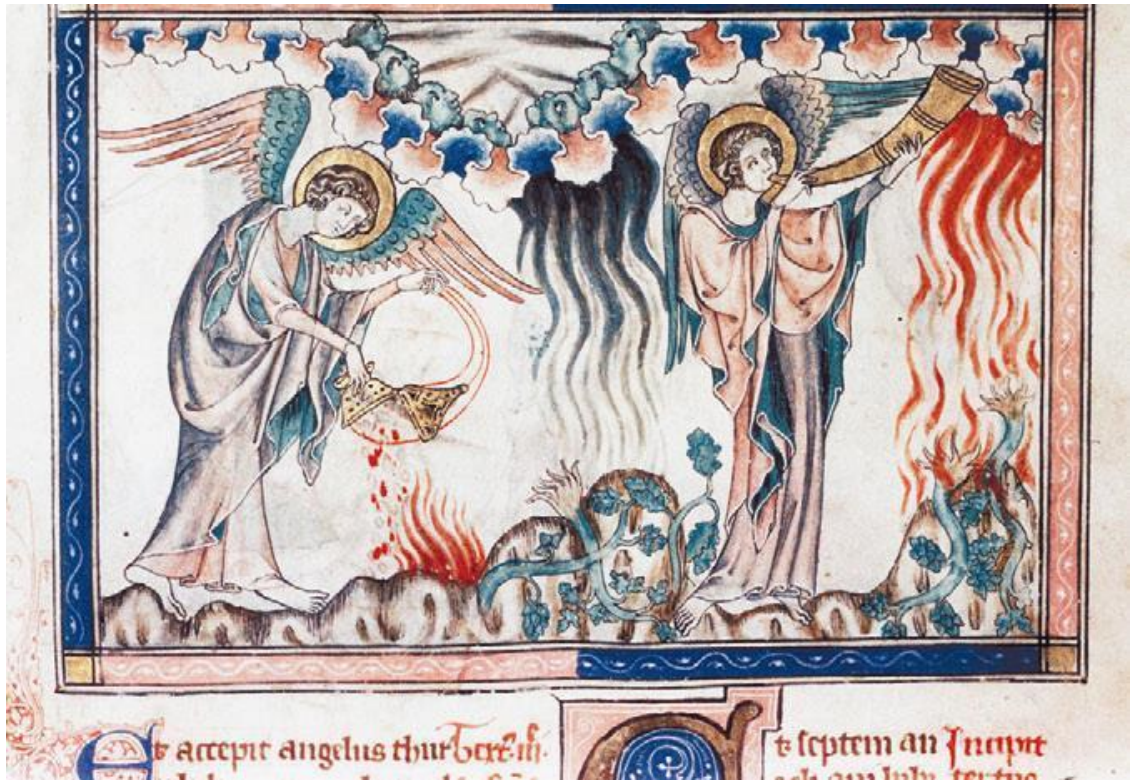
Рис. 16. Второй Ангел вострубил, и как бы большая гора, пылающая огнем, низверглась в море; и третья часть моря сделалась кровью, и умерла третья часть одушевленных тварей, живущих в море, и третья часть судов погибла. Франция, конец XIII в. Paris. Bibliothèque nationale de France. Lat. 14410, fol. 19r.

Третий ангел вострубил, и упала с неба большая звезда, горящая подобно светильнику, и пала на третью часть рек и на источники вод. Имя сей звезде «полынь»; и третья часть вод сделалась полынью, и многие из людей умерли от вод, потому что они стали горьки. Четвертый Ангел вострубил., и поражена была третья часть солнца и третья часть луны и третья часть звезд, так что затмилась третья часть их, и третья часть дня не светла была – так, как и ночи»