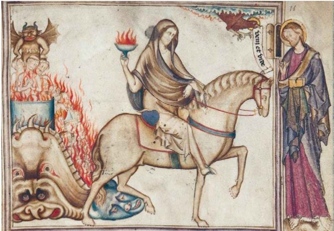
Рис. 10. Всадник на бледном коне по имени Смерть несет в своей руке чашу с адским пламенем. Позади него – разверзшаяся пасть ада, куда чёрт запихивает грешников. Франция, конец XIII в. Paris. Bibliothèque nationale de France. Lat. 14410, fol. 11r.

и перед ним бежит ужас» (Иов. 41:11–14). Кит, поглотивший Иону, также отождествлялся с левиафаном, а его чрево – с адом.