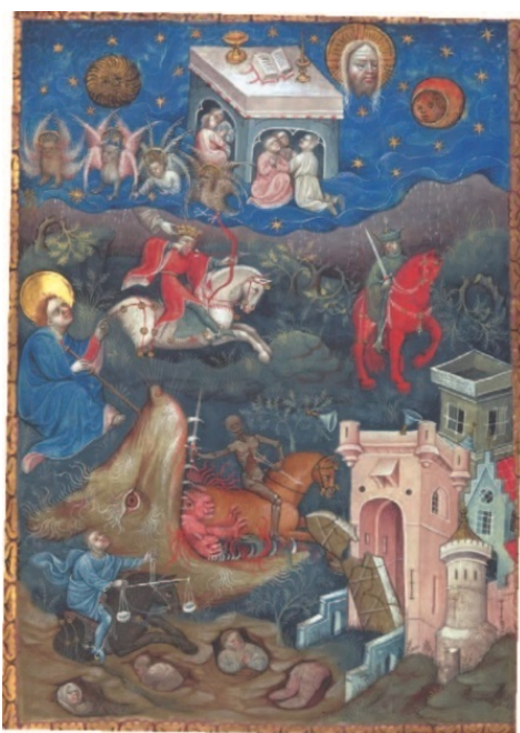
Рис. 12. Нидерландский Апокалипсис XV в. демонстрирует всех всадников одновременно в концентрированном визуальном повествовании.