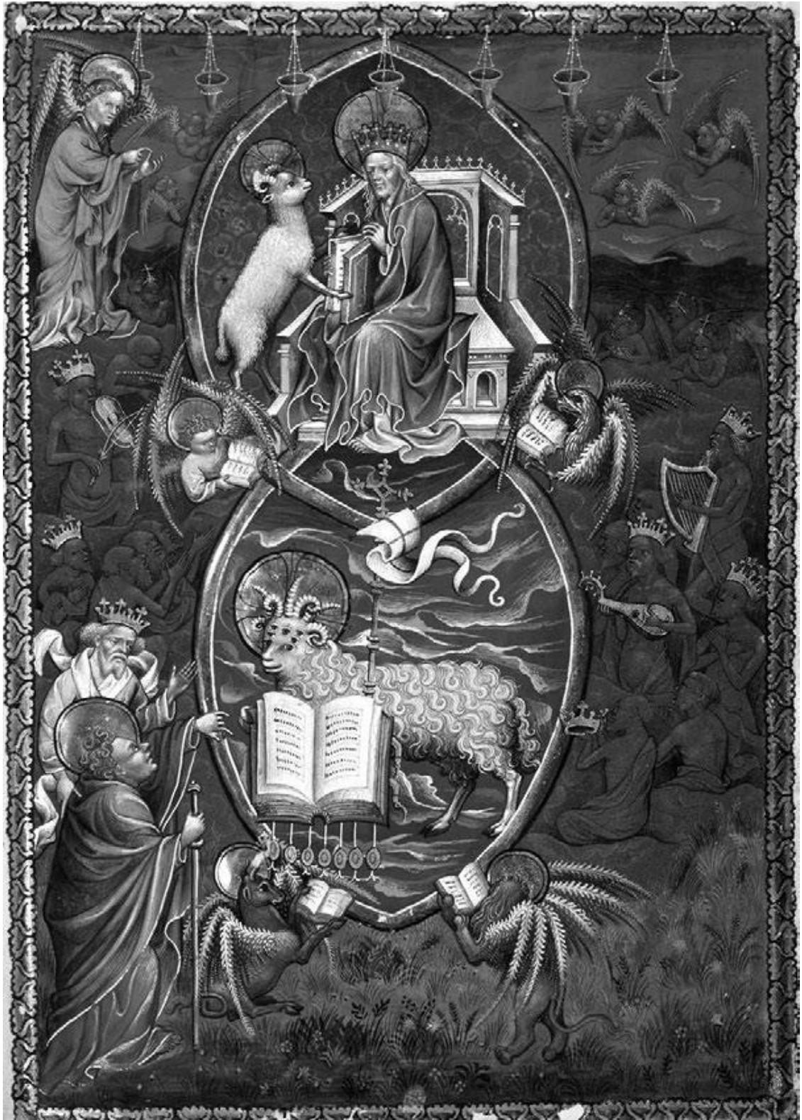
Рис. 6. Посреди семи подсвечников на престоле сидит Сын Человеческий, подле него Агнец (золотые нимбы с вписанным внутрь крестом указывают, что оба есть Христос). Слева изображён один из старцев, объясняющий экзальтированному Иоанну, что Агнцу дана сила открыть Книгу за семью печатями (Откр. 5). Четыре живых существа, славящих Его, начиная с II в. н. э. трактовались как персонификация апостолов. Нидерланды, конец XV в. Paris. Bibliothèque nationale de France. Need. 3, fol. 6r.