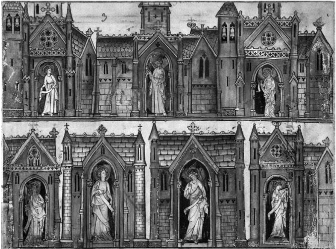
Рис. 3. Красочные соборы с легко распознаваемыми колокольнями, крышей, выложенной каменной черепицей, с розами над готическими порталами и ангелами в белых облачениях посреди дверей – все эти детали кодируют образ послания семи церквам. Франция, конец XIII в. Paris. Bibliothèque nationale de France. Lat. 14410, fol. 3v.

щий, вокруг Него двадцать четыре старца в белых одеждах с золотыми венцами. «И от престола исходили молнии и громы и гласи, и семь светильников огненных горели перед престолом, которые суть семь духов Божиих; и перед престолом море стеклянное, подобное кристаллу; и посреди престола и вокруг престола четверо животных, исполненных очей спереди и сзади. И первое животное было подобно льву, и второе животное подобно тельцу, и третье животное имело лице, как человек, и четвертое животное подобно орлу летящему. И каждое из четырех животных имело по шести крыл вокруг, а внутри они исполнены очей; и ни днем, ни ночью не имеют покоя, взывая: свят, свят, свят Господь Бог Вседержитель, Который был, есть и грядет» (4:5–9).