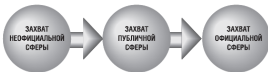
Рис. 1. Коммуникативная модель революции

В этом плане мы видим определенную коммуникативную модель революции: переход от захвата одних коммуникативных потоков и сфер к другим (см. рис. 1).