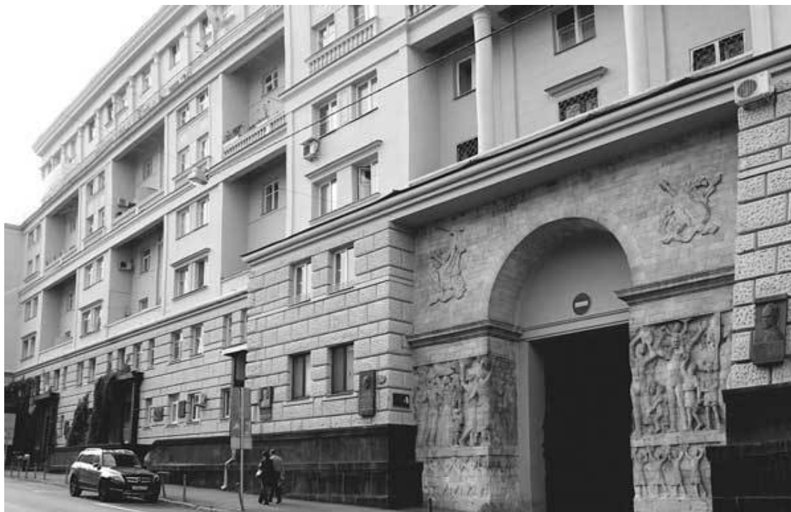
Дом № 5/7 по Глинищевскому переулку

Алла Тарасова, Иван Москвин, Борис Смирнов, Ольга Книппер-Чехова, Михаил Кедров... Это МХАТ. А еще – Вера Марецкая, Иосиф Туманов, Сергей Юткевич. Здесь много лет жили Любовь Орлова и Григорий Александров. Первая доска была установлена в середине сороковых – и на ней имя самого «главного» жителя этого дома Владимира Ивановича Немировича-Данченко.