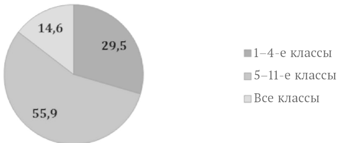
Рис. 2. Распределение респондентов по классам преподавания по результатам мониторинга 2016 г., %

В исследовании представлены учителя как начальной, так и основной и старшей школы, что позволяет выделить специфику их работы в разных классах (рис. 2). Необходимо обратить внимание на то, что 14,6 % выборочной совокупности преподают и в младших, и в старших классах – это преимущественно учителя, работающие в школах мелких территориальных образований.