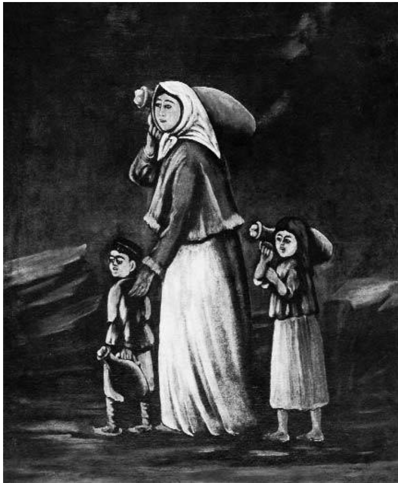
Нико Пиросмани. Крестьянка с детьми идет за водой