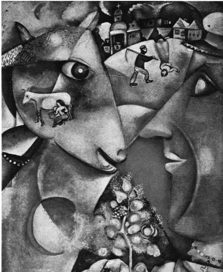
Марк Шагал. Я и моя деревня . 1911