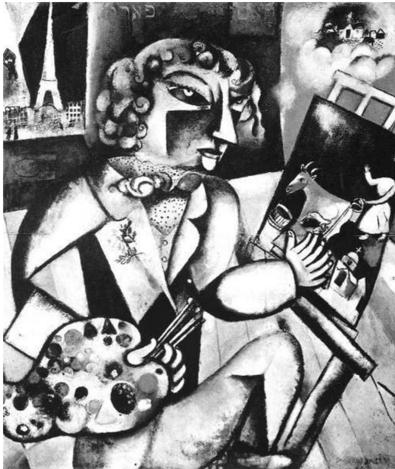
Марк Шагал. Автопортрет с семью пальцами . 1912.