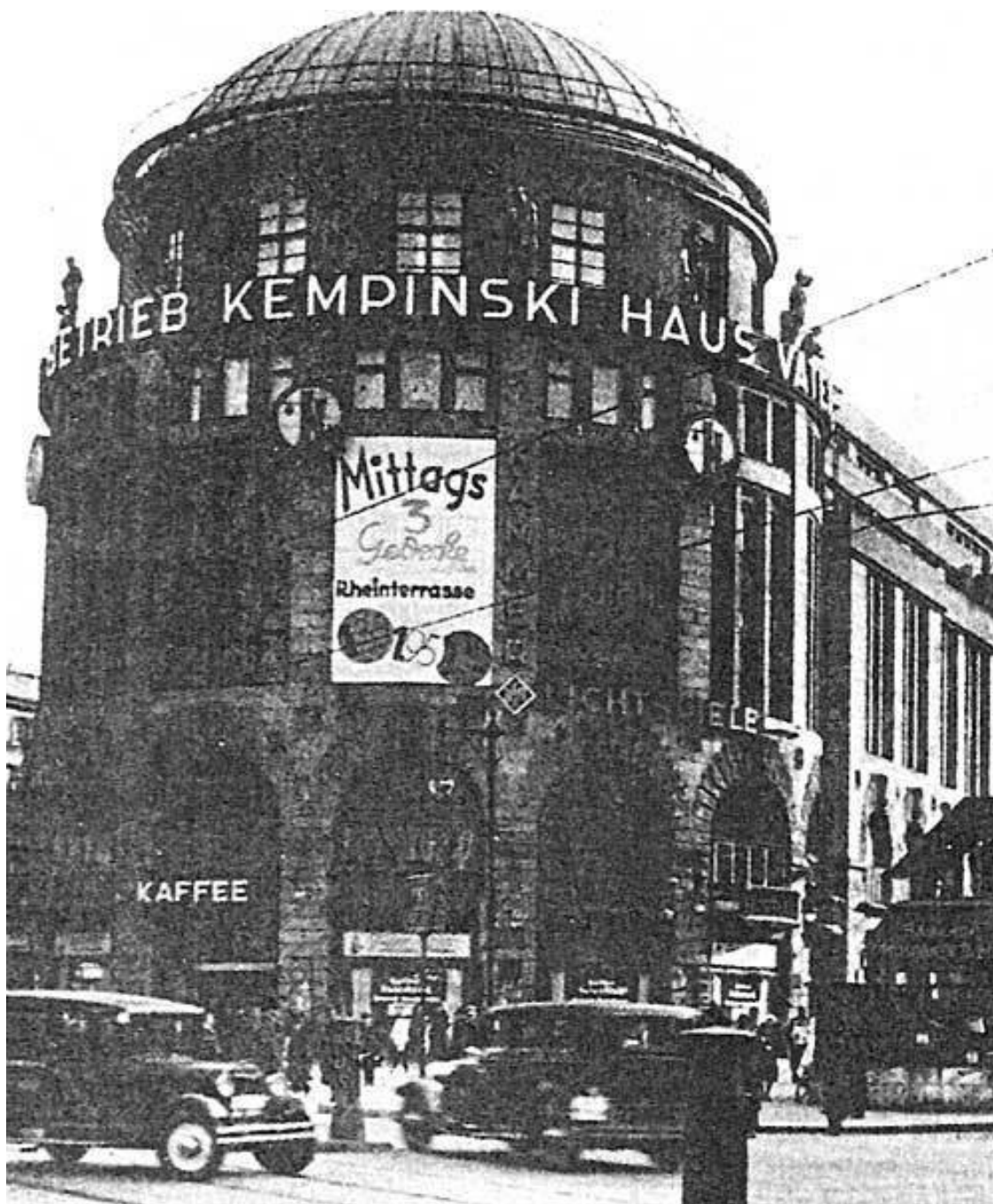
Потсдамская площадь, «Дом Отечества», один из танцевальных дворцов Берлина

Любой город, большой и маленький, новый и древний – это прежде всего его жители. Поэт Андрей Белый, обозревая ночную жизнь Берлина и будучи свидетелем фокстротной лихорадки, охватившей германскую столицу, назвал часть молодежи представителями «черного интернационала современной Европы» «с “негроидами” в крови» и «ритмом фокстрота в душе»: