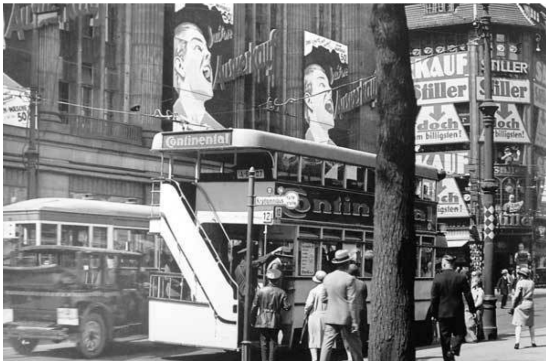
Берлин. Начало 1930-х

нер ценился высоко, – отмечает Михальский. – Среди прочего он играл в 1929 году в оркестре Фреда Мелодиста» 8 .