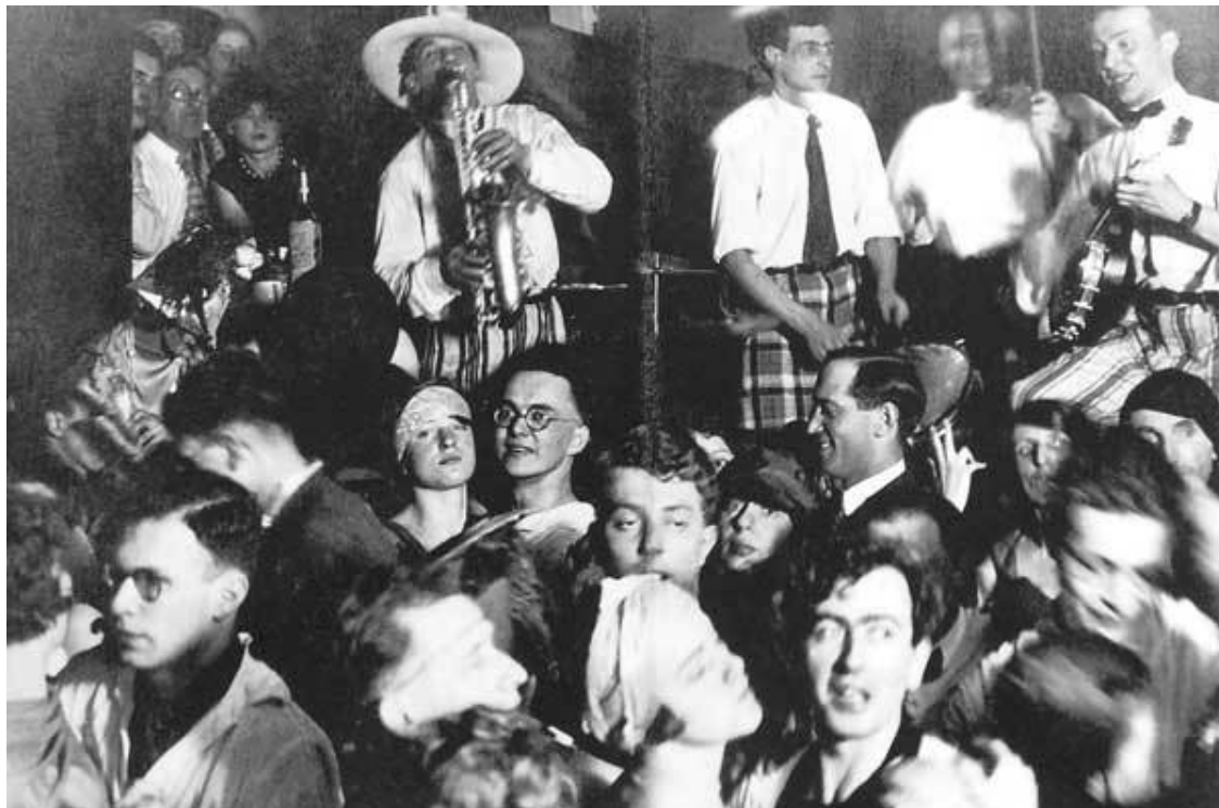
В джазовом кабачке. Берлин, 1930

с подведенными глазами, с короткими волосами перекисиводородного цвета... Те и другие переполняют кафэ в часы пятичасового чая и маленькие “дилэ”... в одном углу гроыхает “джазбанд”... молодые люди встают; и со строгими лицами, сцепившись с девицами, начинают – о нет, не вертеться – а угловато, ритмически поворачиваться и ходить... на маленьком пространстве между столиков появляется оголенная танцовщица-босоножка».