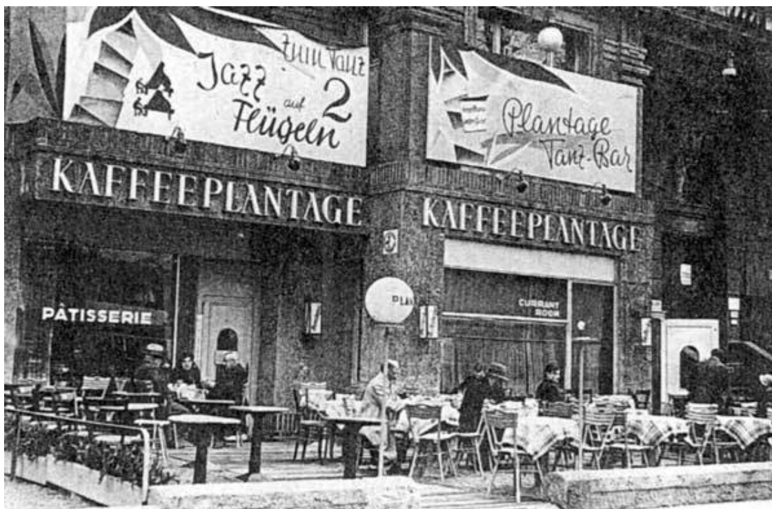
Танцкафе на Курфюрстендамм

Окраины Берлина полнились эмигрантами. Эмигранты попадали не только в «праздно танцующий город», но в «западную западню» – раздираемую противоречиями страну, где поднимали голову шовинизм и расизм.