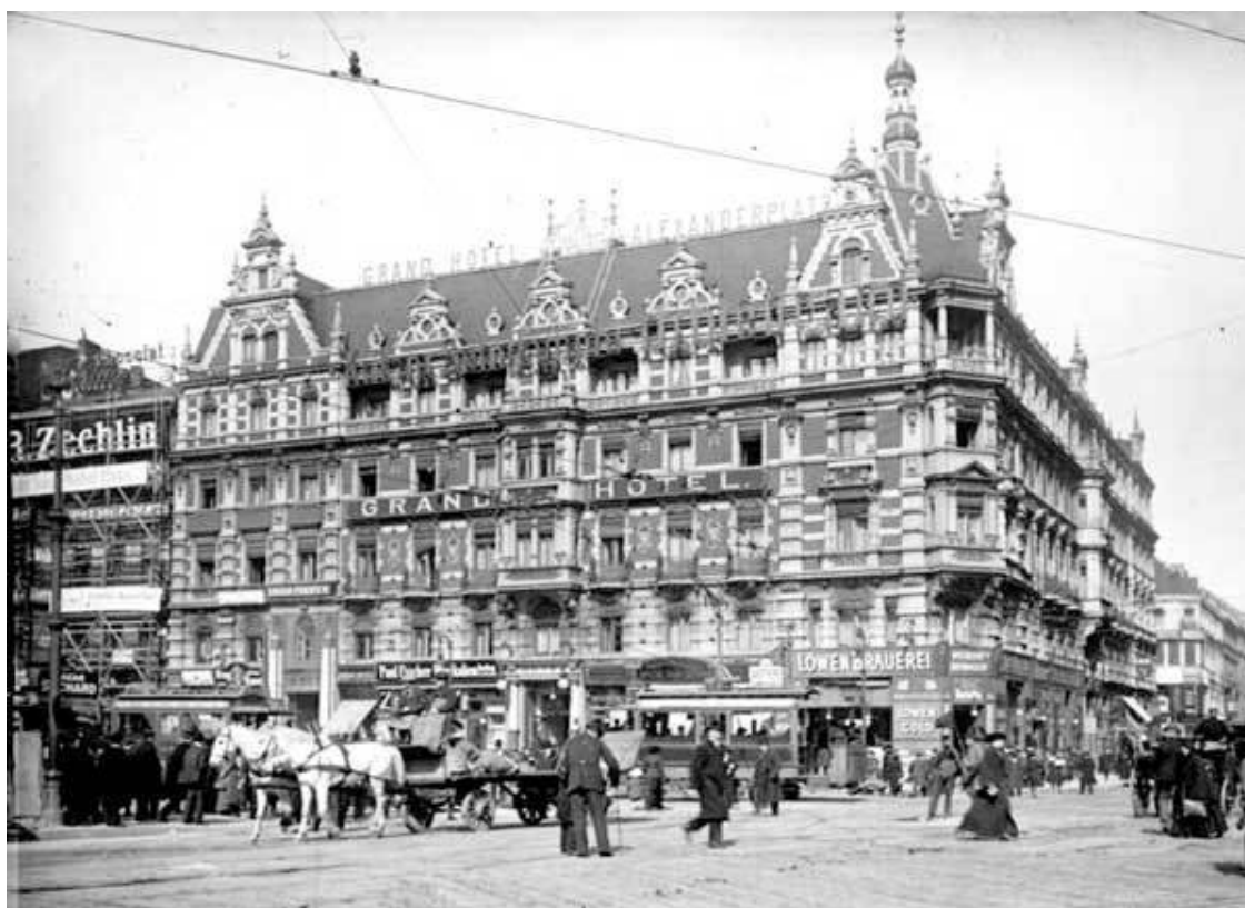
Гранд-отель на Александрплац, 1910-е

Многие события созвучны сегодняшним. Китай воюет с Тибетом, Далай-лама бежит, знакомое имя – Бутрос Гали – президент Египта и дед будущего генсека ООН становится жертвой политического покушения. Албанцы бунтуют в Косове, британский летчик-лихач приземляет свой аэроплан вблизи Белого дома – едва ли не так же, как западногерманский воздушный хулиган Руст на Красной площади семьдесят семь лет спустя. В Брюсселе проходит Всемирная выставка.