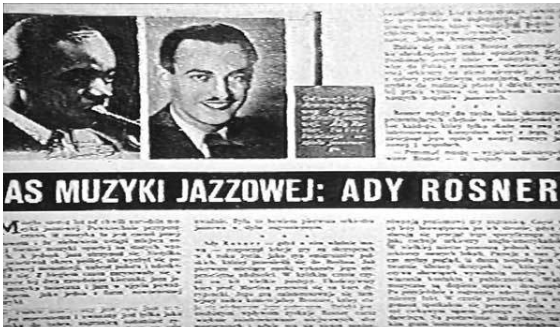
Статья из польского журнала 1930-х годов о «белом Армстронге»