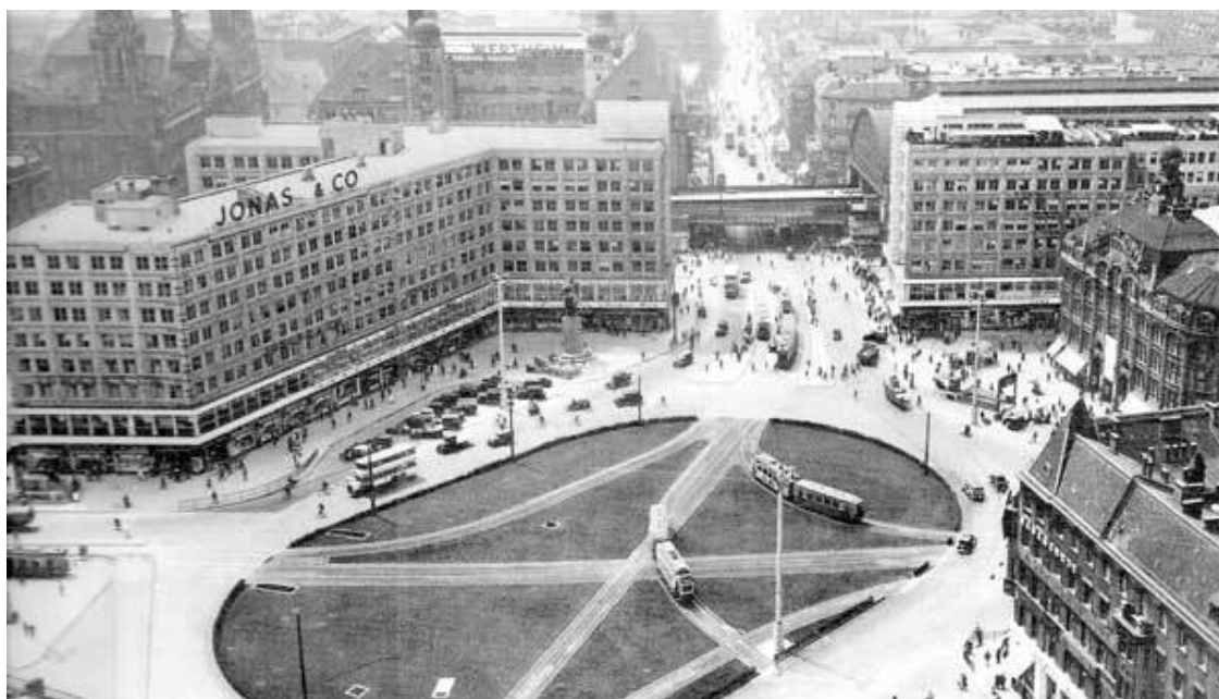
Берлин. Александрплац. 1930-е