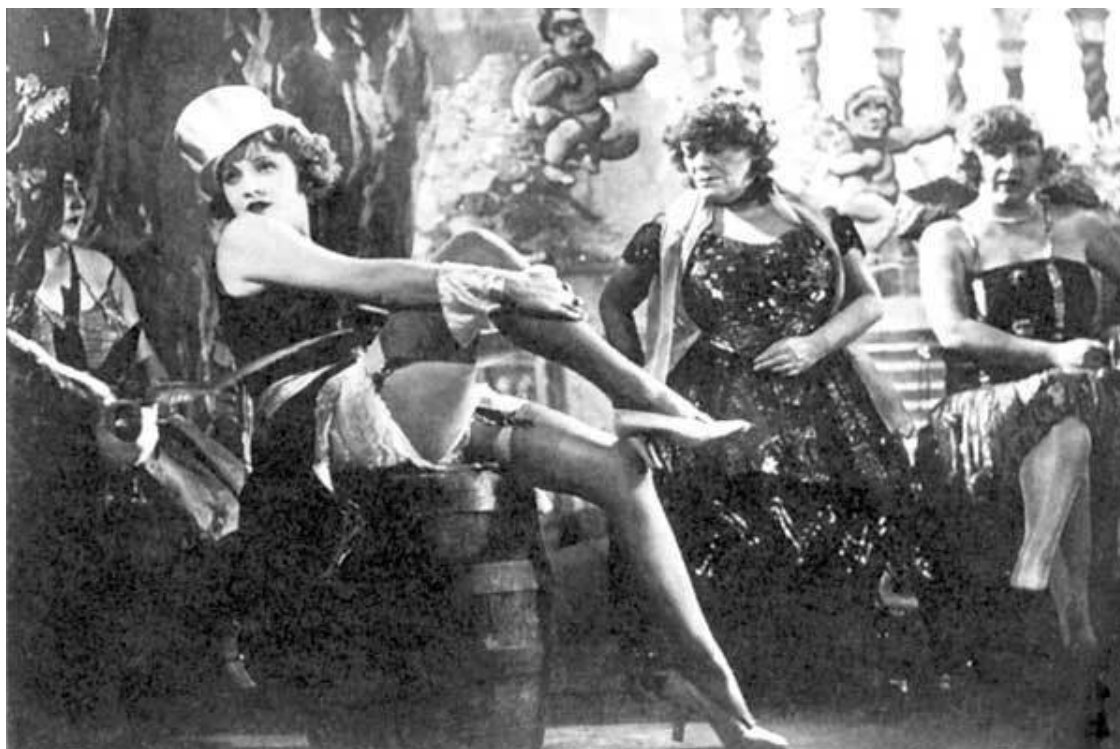
Марлен Дитрих в фильме «Голубой ангел»

Всё шло своим чередом. Удача сопутствовала «вайнтраубам». Гастрольный дебют за рубежом – в 1928 году, первое турне по Германии – в 1930-м. Всюду аншлаги, доброжелательные и восторженные отклики в прессе, иногда – легкий привкус скандала. В ревю Bitte einsteigen ансамбль выступал с нашумевшей танцовщицей и певицей-негритянкой из Парижа Жозефин Бейкер. В сентябре 1929 года «синкопаторы» участвовали в скандальной премьере пьесы «Купец из Берлина», музыку к которой написал симфонист Ханс Эйслер, будущий автор гимна ГДР. От появления звукового кино Вайнтрауб и его команда только выиграли – в то время как другие музыканты, занимавшиеся иллюстрацией фильмов, лишились этой работы, Weintraub Syncopators перебрались с просцениума на экран.