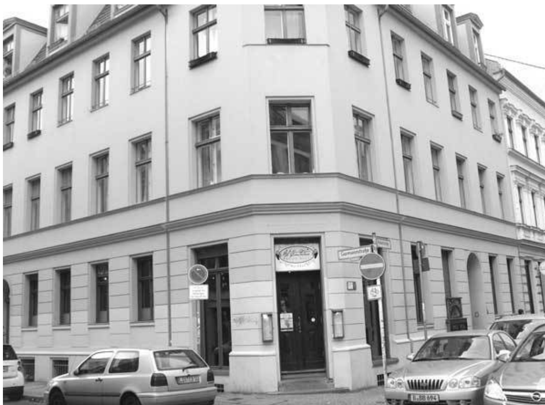
Дом на Горманнштрассе, 10–11, где Ади жил с родителями

«Отец мой родился в рабочей семье... – напишет Рознер. – Родители отца, не обеспеченные материально, вынуждены были отдать его на ученье в сапожную мастерскую в возрасте 8 лет. Хозяин-сапожник уехал в г. Вену... и взял ребенка с собой. Там он освоил специальность сапожника и в 17-летнем возрасте уехал в Берлин, где работал в сапожной мастерской у хозяина. В возрасте 21 года отец женился и продолжал работать по специальности...» 1