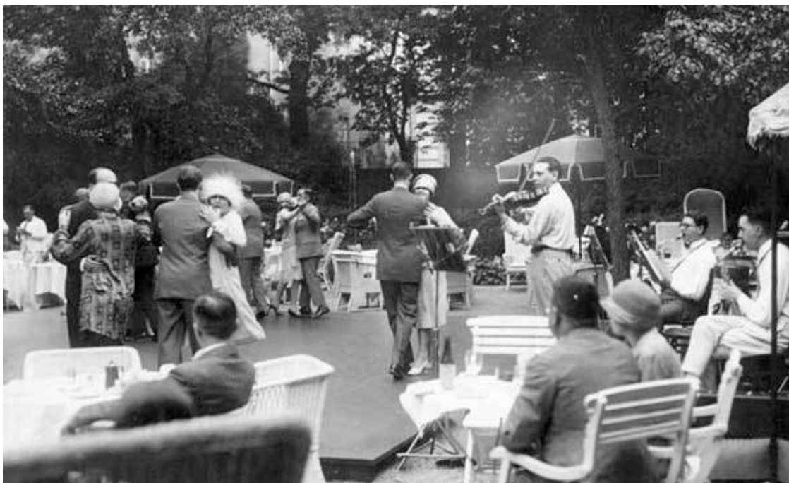
Файв-о-клок в отеле «Эспланада». 1926