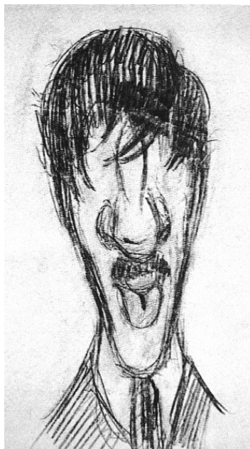
К. И. Чуковский. Шарж Ю. П. Анненкова