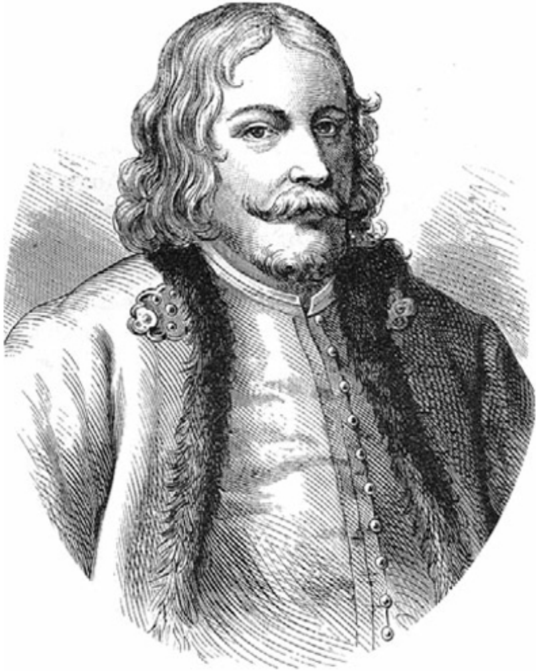
Василий Васильевич Голицын

Голицын, несомненно, произвел очень сильное впечатление на Софью, и она сильно привязалась к нему. В письмах она звала его «свет братец Васенька», «свет батюшка, душа моя, сердце мое», а однажды собственноручно сделала такую надпись на его портрете: