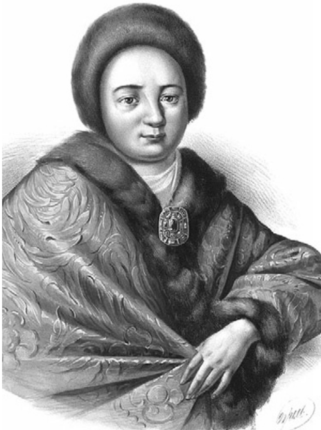
Нарышкина Наталья Кирилловна, мать Петра I

«Свобода и веселье» молодой царицы удивляли иностранцев и вызвали недовольство у соотечественников. В начале своей жизни Алексей Михайлович очень серьезный и набожный юноша, на их свадьбе с Марией Милославской не было скоморохов, хотя обычай предписывал их участие в торжествах. Теперь с молодой женой царь начал позволять себе просто веселиться. Они с Натальей катались по столице в карете с незанавешенными окнами, что шокировало москвичей.