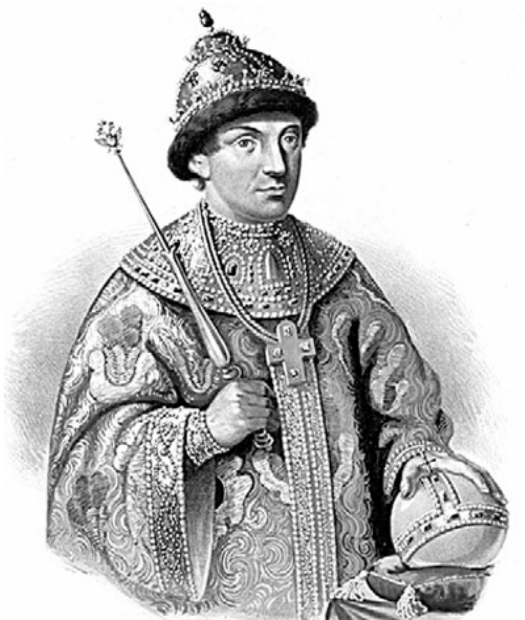
Федор Алексеевич Романов

А что же молодой царь? Костомаров пишет о нем: «Еще менее можно было ожидать действительной силы от особы, носившей титул самодержавного государя по смерти Алексея Михайловича. Старший сын его Федор, мальчик четырнадцати лет, был уже поражен неизлечимой болезнью и едва мог ходить. Само собою разумеется, что власть была у него в руках только по имени». Это заключение кажется очень логичным. Федор, действительно, был молод и действительно был болен. То ли он страдал от цинги, то ли от сердечной, то ли от венозной недостаточности, но ноги его страшно опухали, и даже на похороны отца его принесли в кресле. Конечно же, такой юный и такой слабый царь не мог быть сильным политиком. Но современные историки готовы поправить Костомарова.