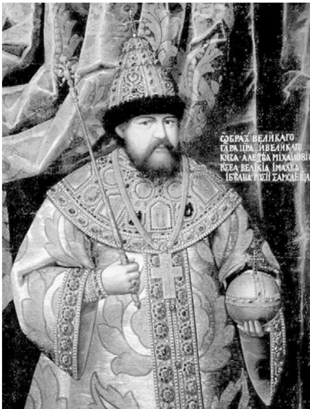
Алексей Михайлович Романов