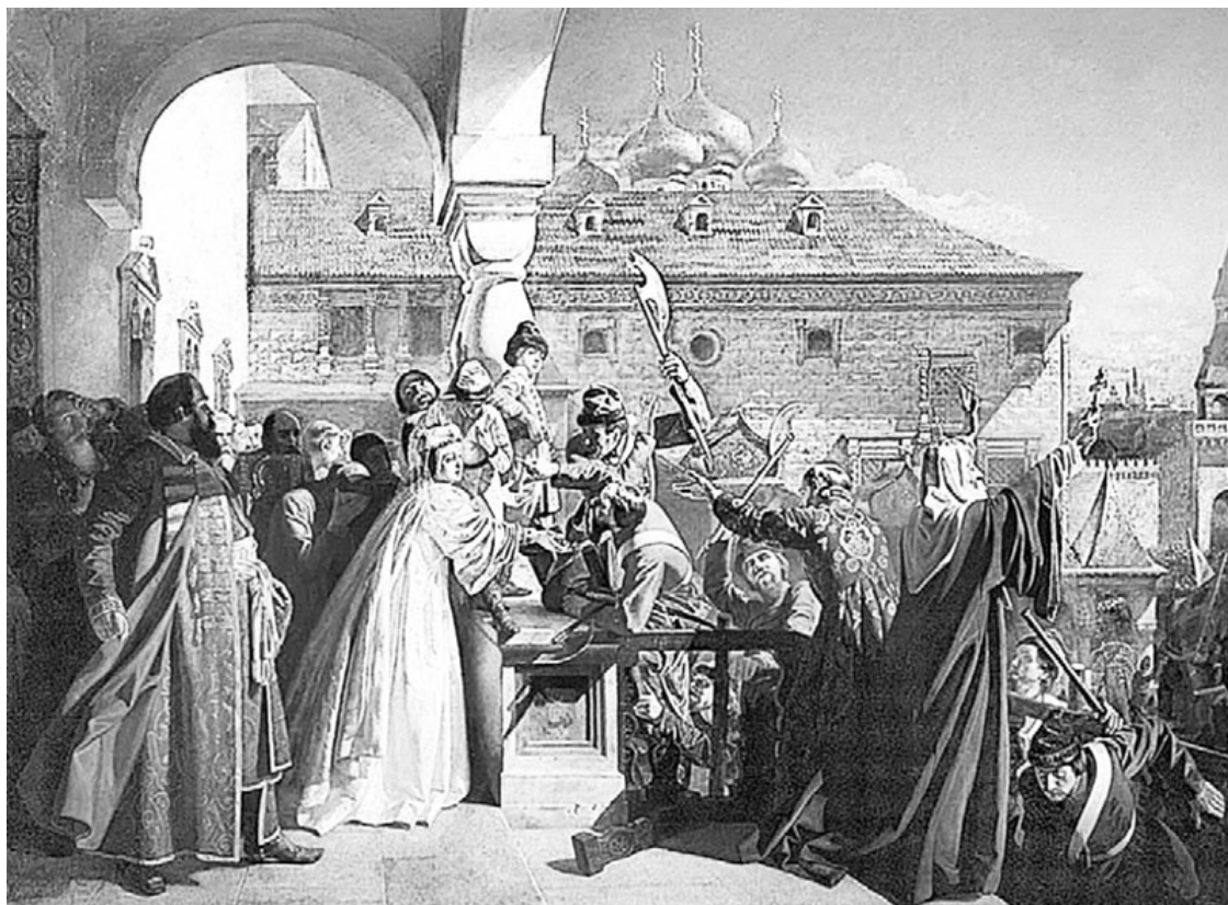
Н. Д. Дмитриев-Оренбургский. «Царица Наталья Кирилловна показывает Ивана V стрельцам»

Вот как историк Костомаров описывает апогей стрелецкого бунта. Стрельцы ищут Ивана Нарышкина, брата царицы Натальи, который, по слухам, надевал на себя царский венец и садился на трон, а когда Софья и Иоанн стали его укорять, то он накинулся на них с кулаками, а потом едва не задушил Иоанна.