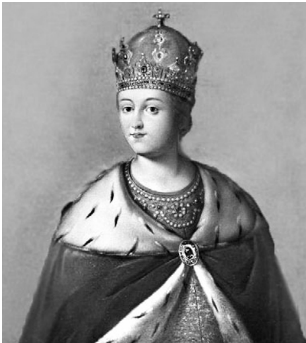
Царевна Софья Алексеевна