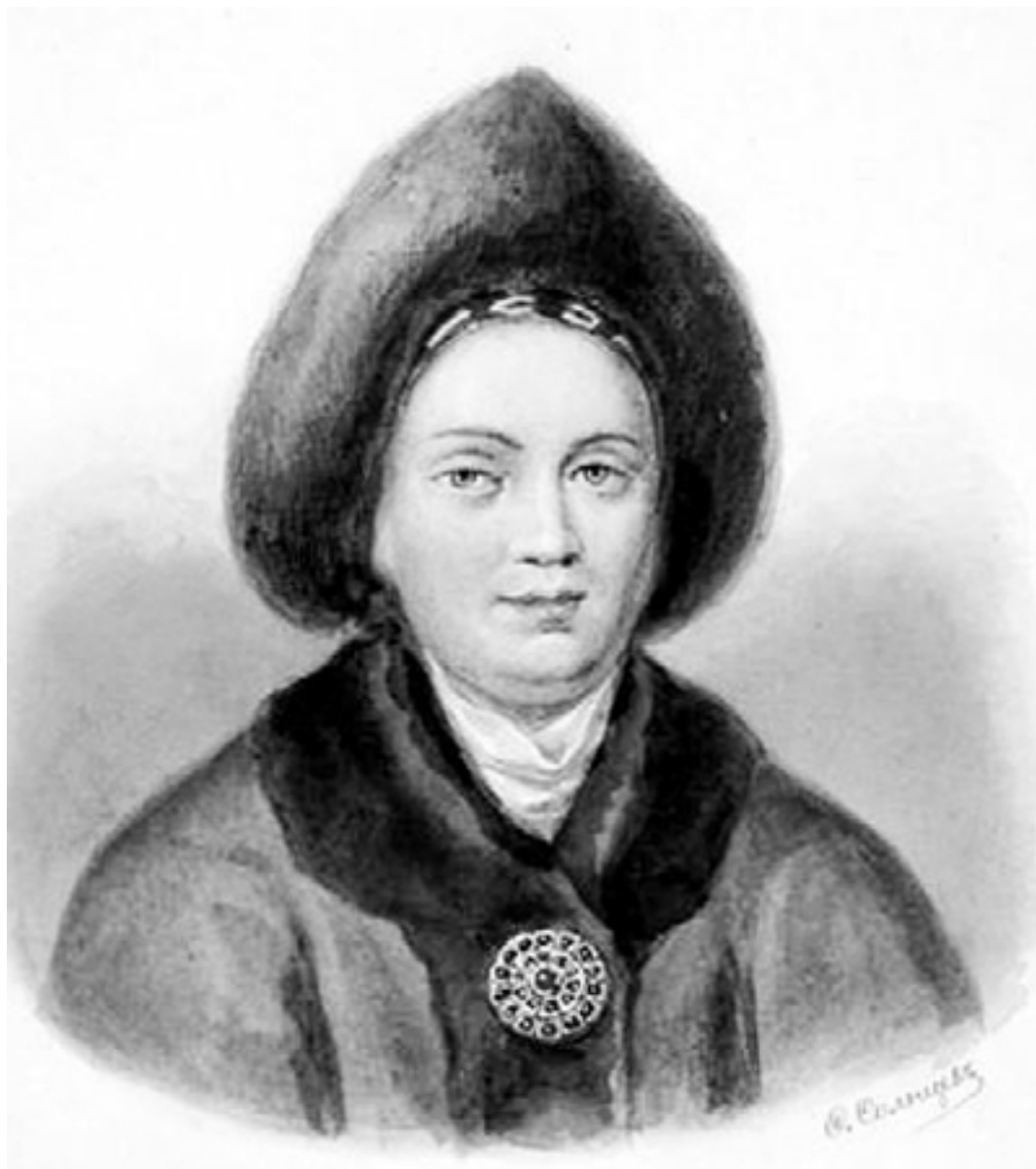
Царевна Марфа Алексеевна

Но, вероятно, самую большую радость Софье доставляли визиты князя Василия Васильевича Голицына. Связанный с царской семьей родством и дружбой, он имел привилегию навещать царицу и царских детей. Князь был из тех русских, кто живо интересовался европейской политикой, европейским образом жизни, европейской культурой. (А таких при Дворе Алексея Михайловича становилось все больше.)