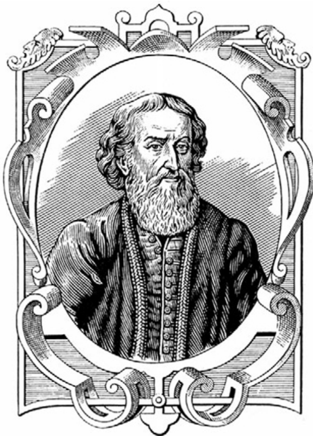
Артамон Сергеевич Матвеев

Вокруг царевен начала формироваться некая политическая партия, враждебная царице. Николай Иванович Костомаров пишет: «Шестеро сестер нового государя ненавидели мачеху Наталью Кирилловну; с ними заодно были и тетки, старые девы, дочери царя Михаила; около них естественно собрался кружок бояр; ненависть к Наталье Кирилловне распространялась на родственников и на сторонников последней. Прежде всех и более всех должен был потерпеть Артамон Сергеевич Матвеев, как воспитатель царицы Натальи и самый сильный человек в последние годы прошлого царствования. Его главными врагами, – кроме царевен, в особенности Софьи, самой видной по уму и силе характера, и женщин, окружавших царевен, – были