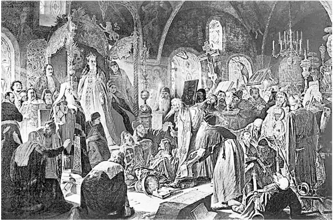
В. Перов. «Никита Пустосвят. Спор о вере». 1880–1881 гг.

Каждая сторона считала, что победа осталась за ней. Но стрельцы услышали угрозу Софьи покинуть Москву вместе с братьями и хором заявили, что им «до старой веры дела нет». Софья, услышав то, что ей было нужно, принялась награждать выборных «депутатов» от стрельцов, пришедших в Грановитую палату. Заручившись их поддержкой, царевна на следующее утро приказала схватить староверов. Никиту казнили на Лобном месте, а его соратников отправили по монастырям, откуда некоторым удалось бежать и продолжать распространение раскола.