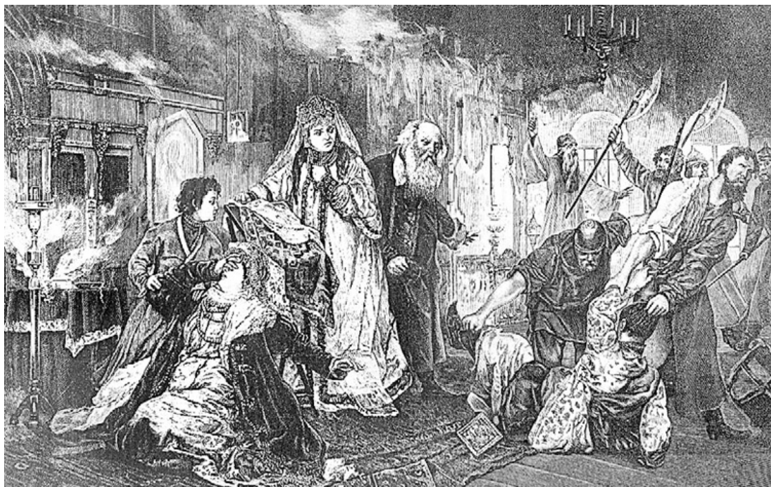
А. И. Корзухин. «Мятеж стрельцов в 1682 г.». 1882 г.

Вероятно, эти события стали одним из самых страшных воспоминаний юного Петра, в тот день он научился не доверять ни стрельцам, ни московским боярам и стремился избегать их.