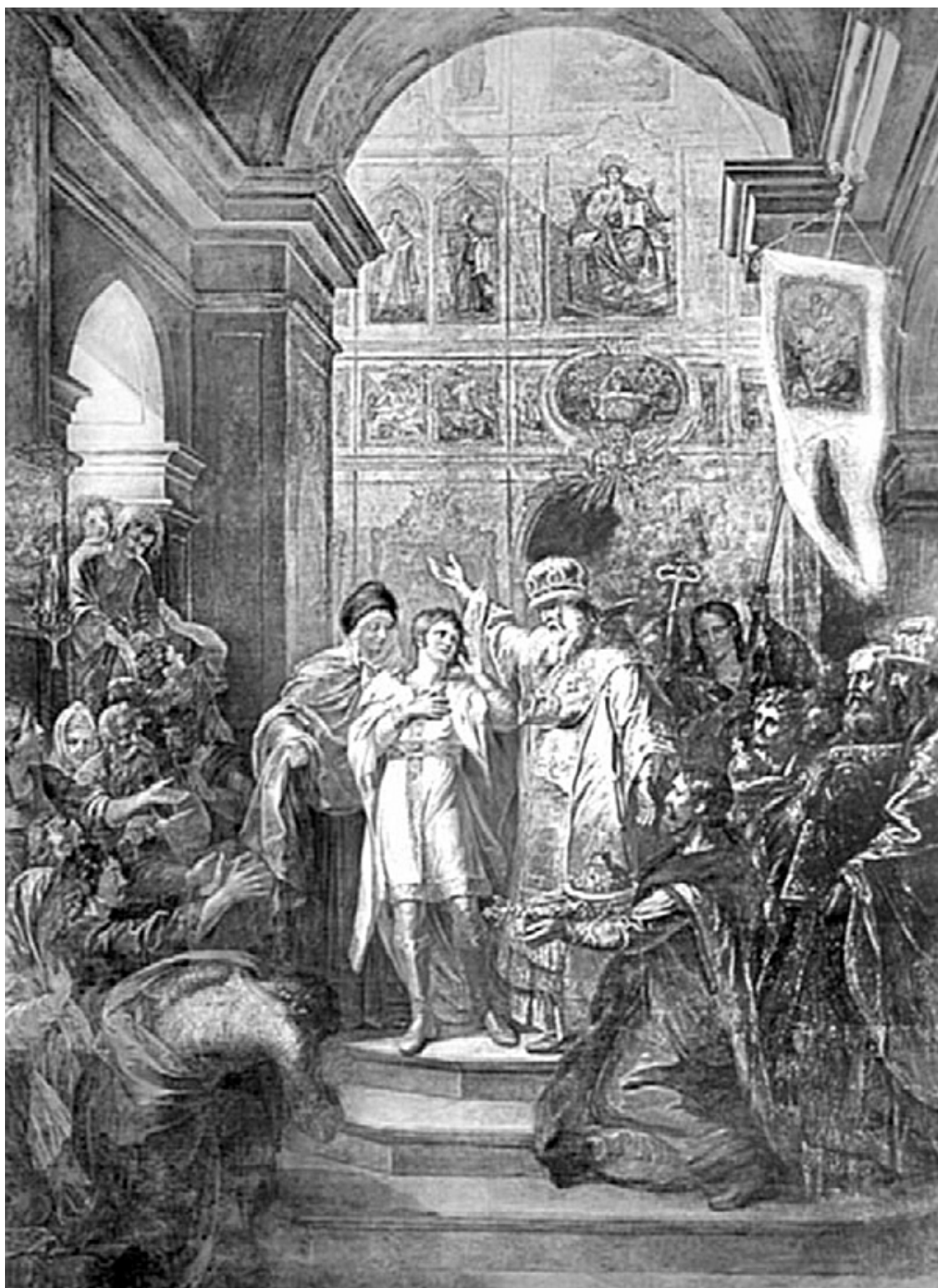
Г. Угрюмов. Призвание Михаила Федоровича Романова на царство 14 марта 1613 г.

Михаил Федорович провел первые годы царствования, сражаясь с поляками, литовцами, шведами, казаками. Федор Никитич переехал в Москву и взял правление в свои руки.