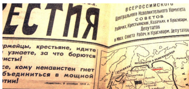
Тулгас на карте, опубликованной в газете «Известия»

После освобождения Шенкурска именно Тулгас обозначали на советских картах 1919 года под общим названием «Советская Россия в кольце фронтов». Ниже приводится фрагмент газеты «Известия» от 8.10.1919г. с такой картой. Здесь Тулгас обозначен на линии фронта, но к этому времени фронт уже сместился на север.