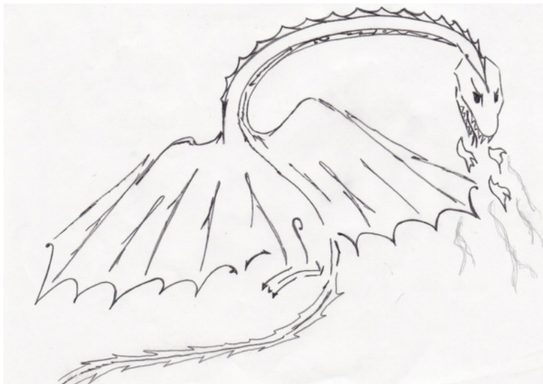
Рисунок автора, 2011 г.

Вмещала все мечты её и цели. И девушка, знакомый силуэт Надеясь встретить, не спускала взора. Пусть год пройдёт и даже много лет — Вернётся друг. Сегодня. Завтра. Скоро.