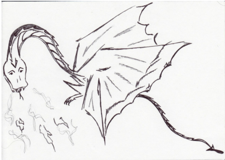
Рисунок автора, 2011 г.

Она стояла на вершине диких скал. Об их подножье бились волны океана. Восточный ветер кудри разведал Гречанки с редким именем Диана. Струилось платье, форму смуглых плеч Изящным силуэтом облекая, И, не стараясь жизнь свою беречь, Не отходила девушка от края. Был взгляд её решителен и смел, Хотя обрыв от ног её так близко.