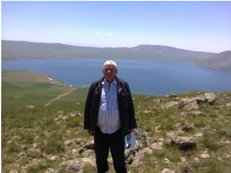
Автор. На заднем фоне Рыбное озеро. Турция, Игдыр