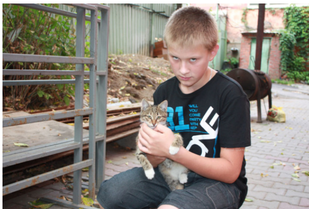
Мальчик с котёнком