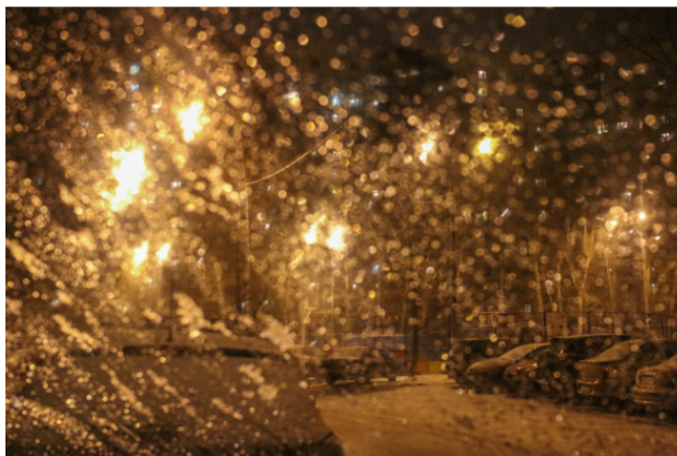
Снег с дождём

Действие мини-романа происходило в те годы, когда ещё не было мобильных телефонов.