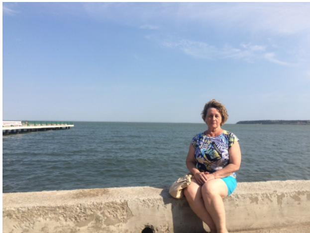
Крым Керченский пролив