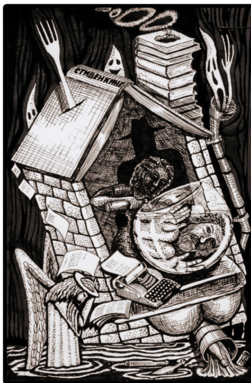
Дом, который построил я