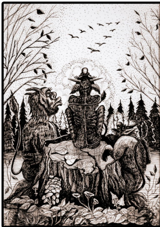
В тёплые края бы...

Нет! Не дождётесь, глупые люди, Чтоб себя, я живьём хоронил. Плюю на слова: «Никогда не буду» И холод могильный мне вовсе не мил!!!