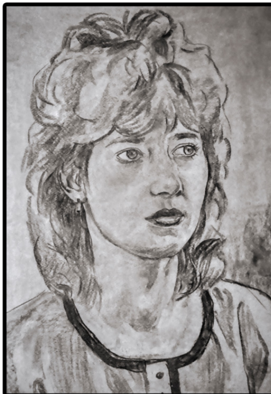
Марина (рисунок неизвестного художника)