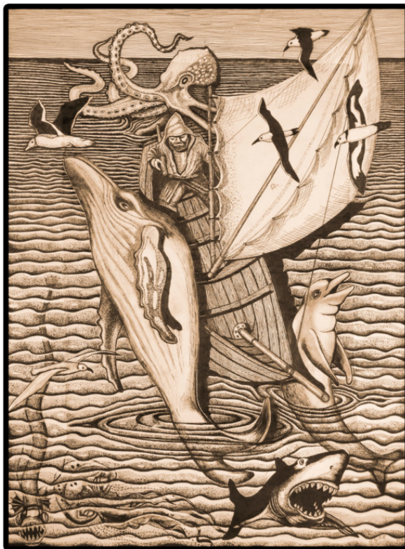
Нет места человеку в океане