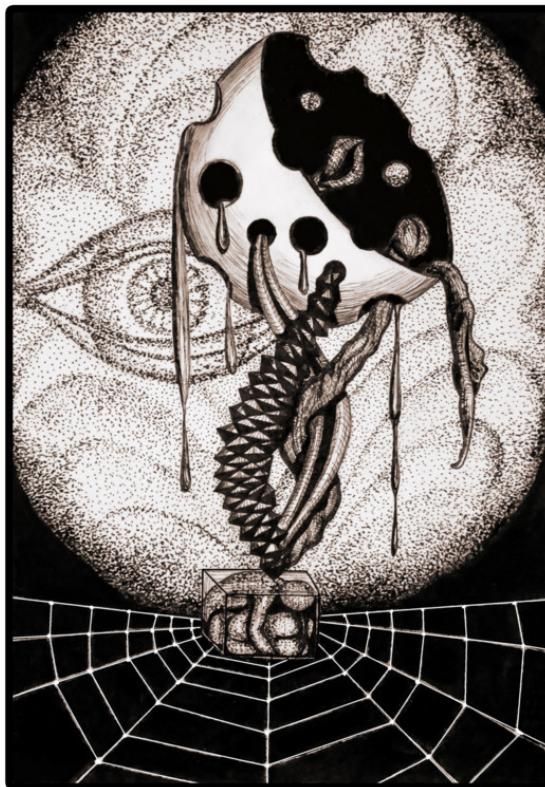
Чума 20-го века. СПИД