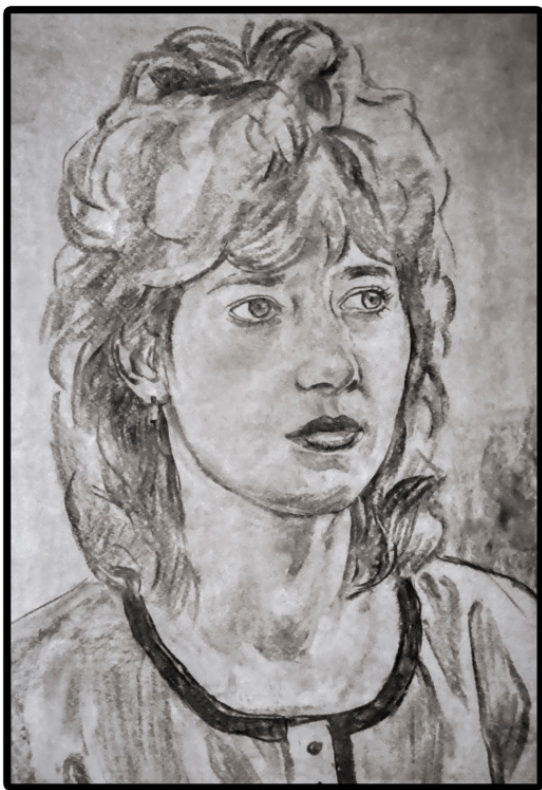
Марина (рисунок неизвестного художника)