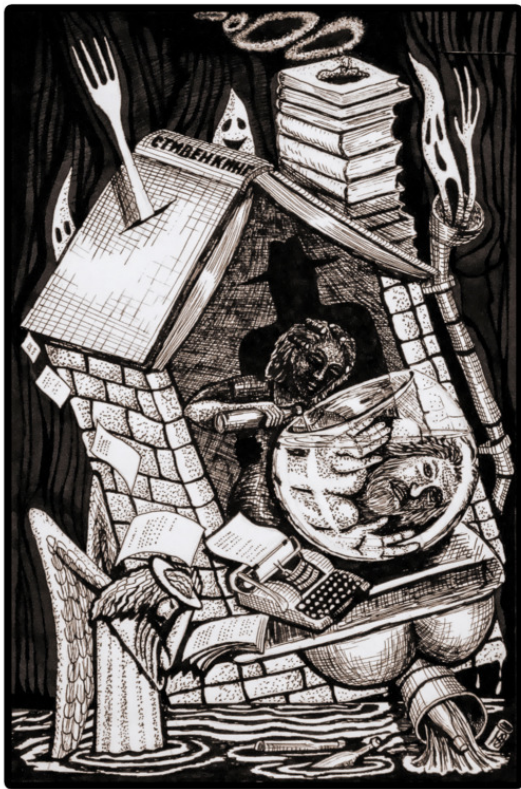
Дом, который построил я