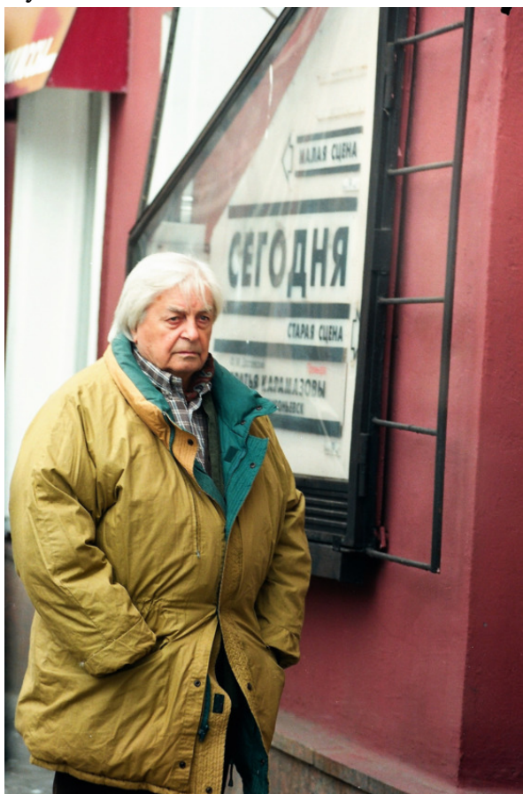
Юрий Петрович Любимов. «Мысль почувствовать.»

Создано в интеллектуальной издательской системе Ridero