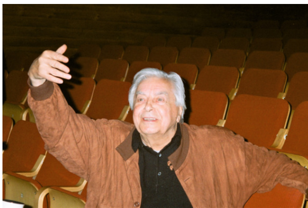
Юрий Петрович Любимов.