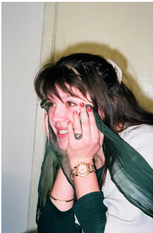
Актриса Екатерина Рябушинская. Из серии «Репетиция взгляд актера».