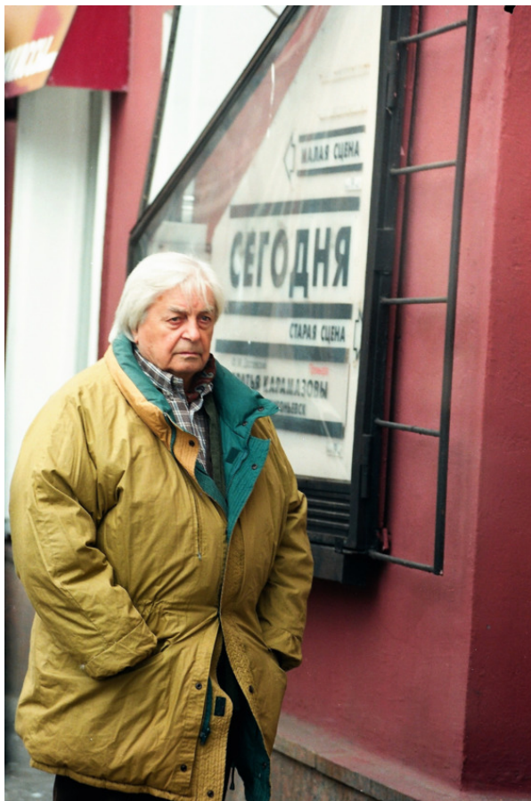
Юрий Петрович Любимов. «Мысль почувствовать.»