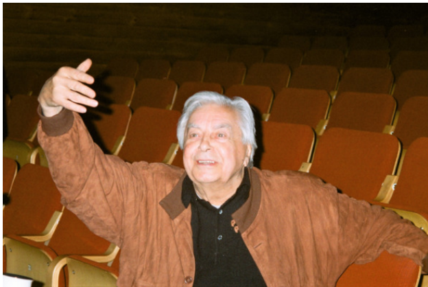
Юрий Петрович Любимов.