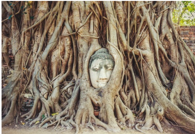
Микеланджело, Апостол Матфей, 1505–1506.