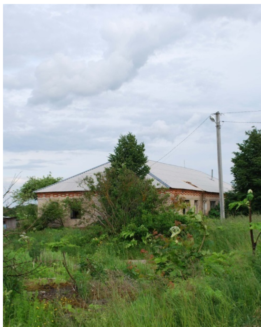
Дом, где жила мамина сестра

Напротив – первый сельский дом из бревен. Его практически не видно, он утонул в одичавшем саду, огражденном покосившимся забором. А возле – качели!