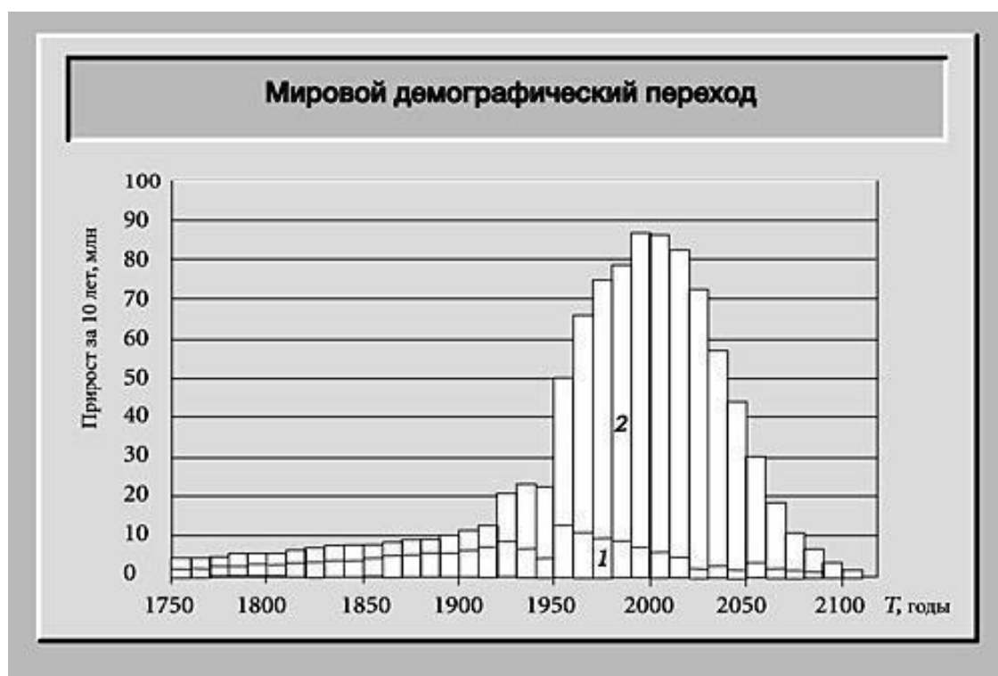
Рис. 2. Демографический переход 1750–2100 гг. Прирост населения за декады лет: 1 в развитых и 2 в развивающихся странах. (С. П. Капица. Информационное развитие общества, демографическая революция и будущее человечества, 2006).