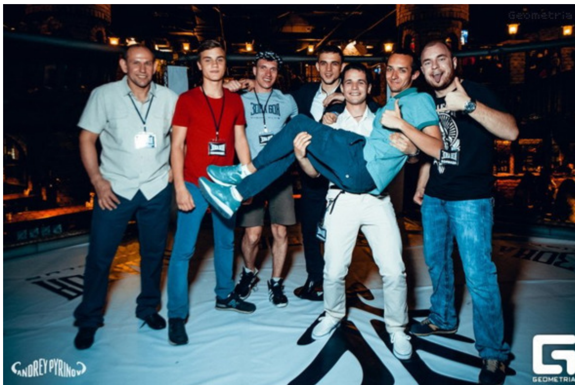
Команда клуба «Зона Боя» сразу после турнира

2 мая 2015 года в центре города Воронежа, Галерея Чижова Балаган City, мы провели первый финал из лучших бойцов, прошедших предварительные 7 турниров.