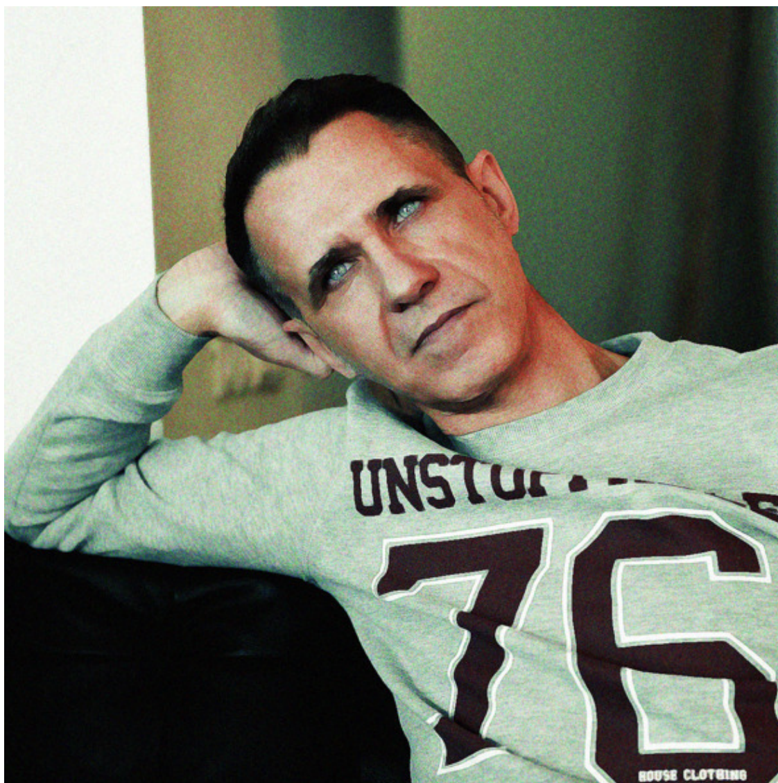
Автор К. Марино.