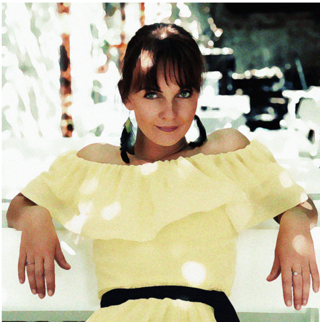
Арришка и *магистерий обскура