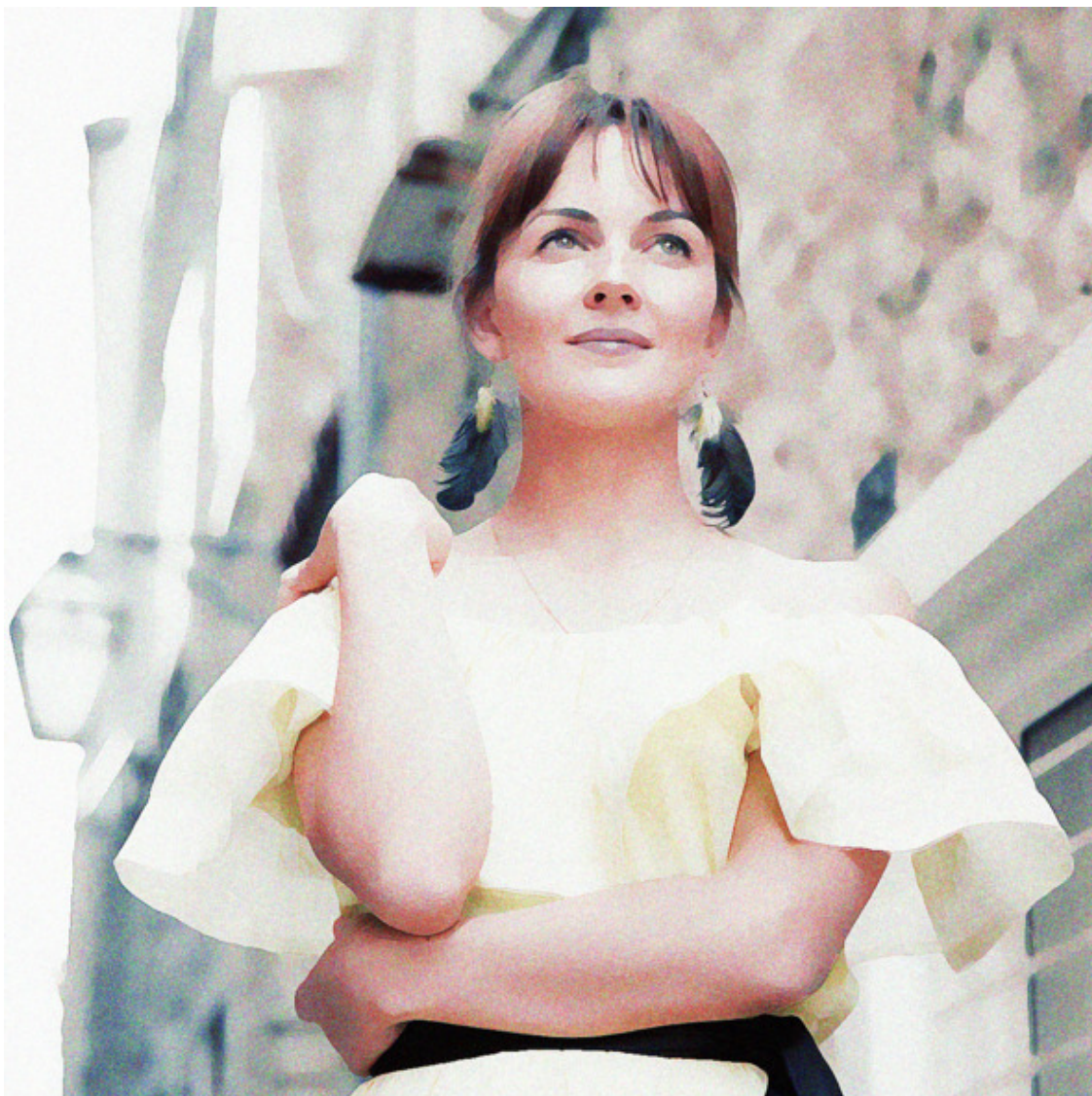
Аршика и источник возрождения