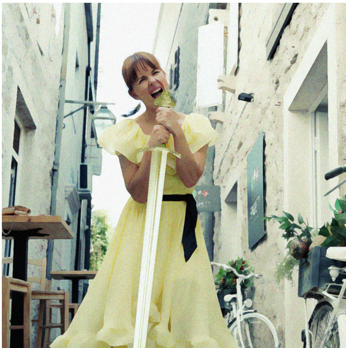
Аршика и клинок света