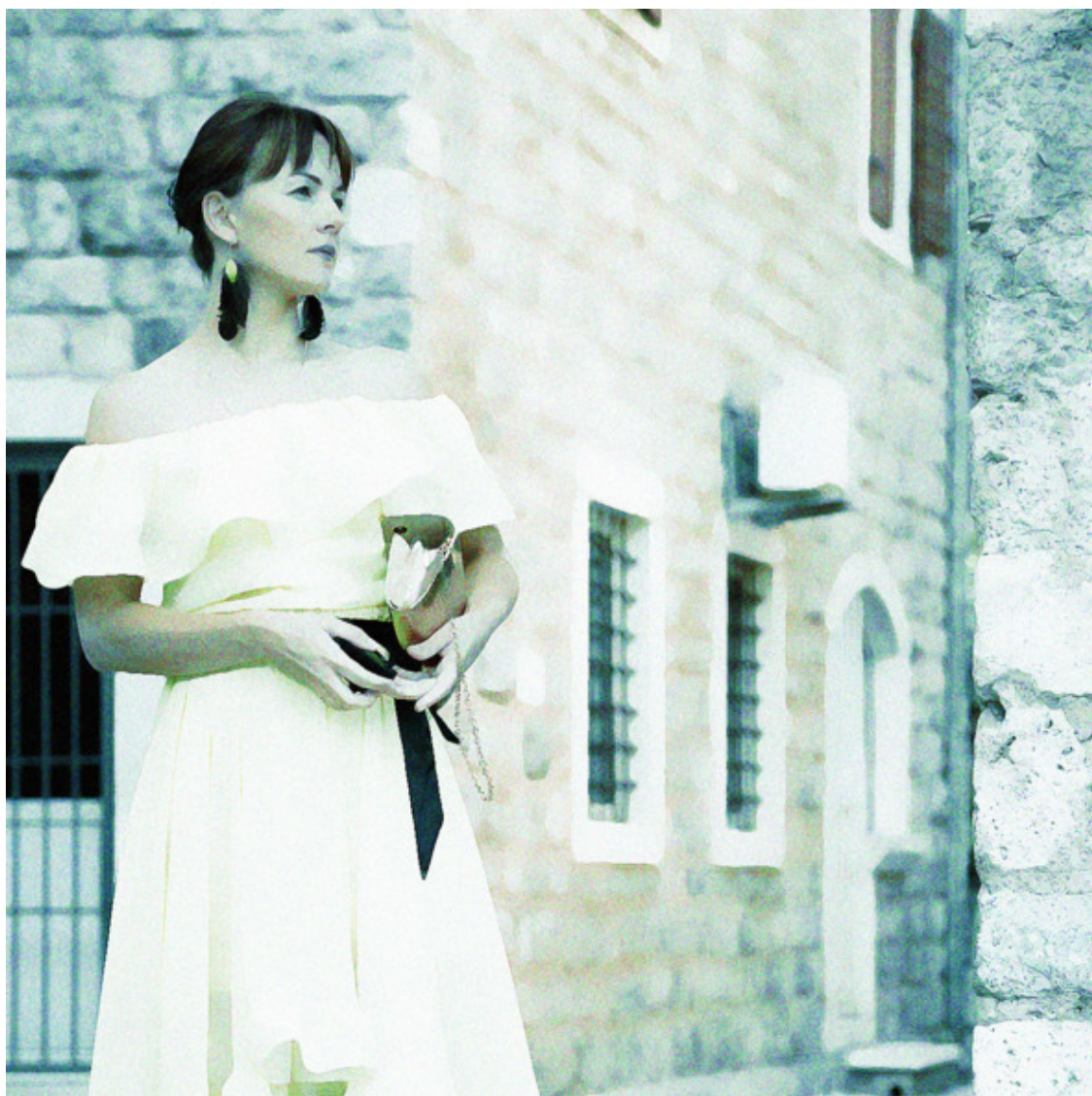
Арришка за границей империи