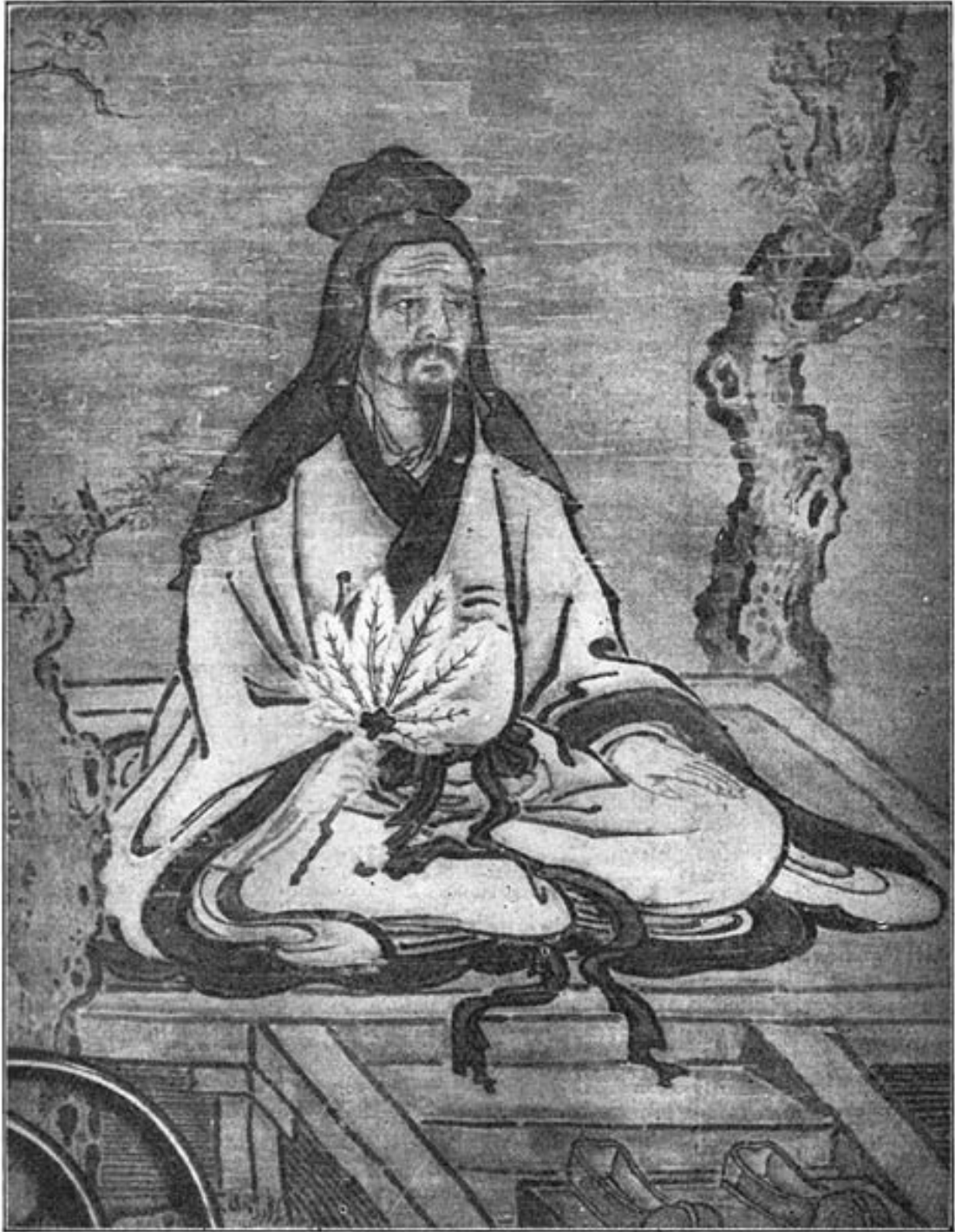
Portret van Confucius. (door den Japanschen schilder Kano Masanobu. gest. 1490)

Het eigenaardige wezen der Chineesche schriftteekens geeft aan de Chineesche poëzie nog eene aparte schoonheids-bekoring, die westersche poëzie niet heeft. De Europeesche letters zijn namelijk op zichzelf doode dingen, de Chineesche schriftteekens hebben een aparte aesthetische en symbolische schoonheid. Zooals Hans Bethge terecht zegt. 9 „Diese Dichtung wendet sich an Ohr und Auge in gleicher Weise”. Bij ons, in 't Westen, is het alleen het oor, dat poëzie opneemt, in China is het ook het oog, daar de schriftteekens, in welke zij is uitgedrukt, op zich zelf teekeningen