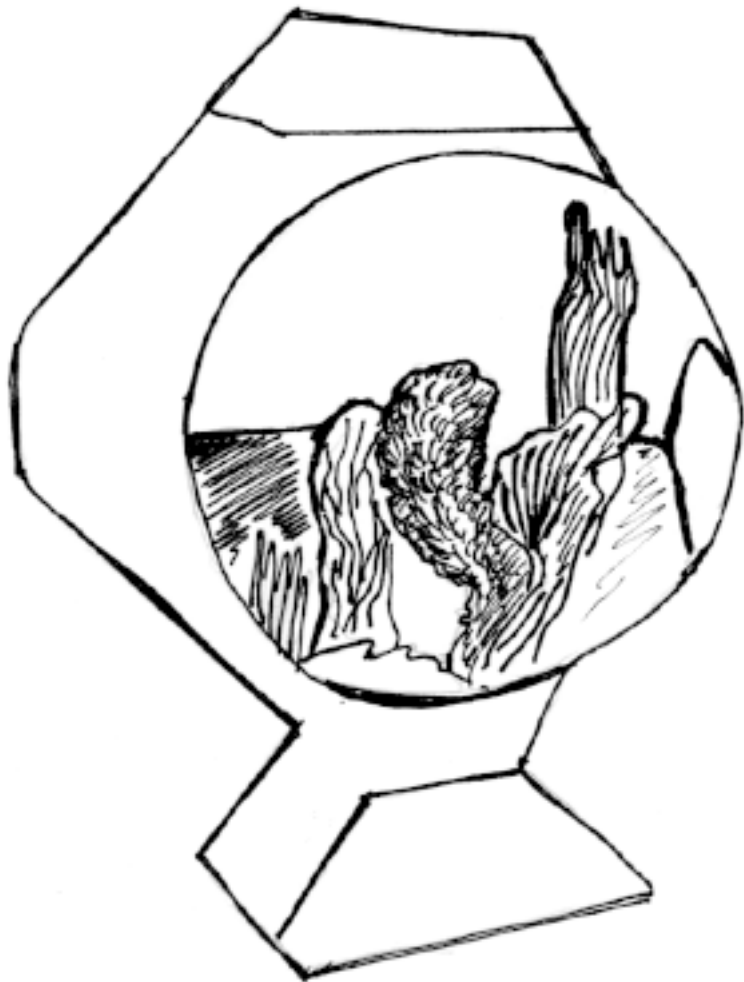
Рис. 2. Круглый аквариум