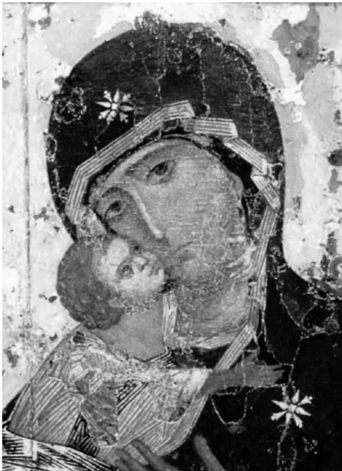
Икона «Богоматерь Владимирская». XII в. Москва, Третьяковская галерея