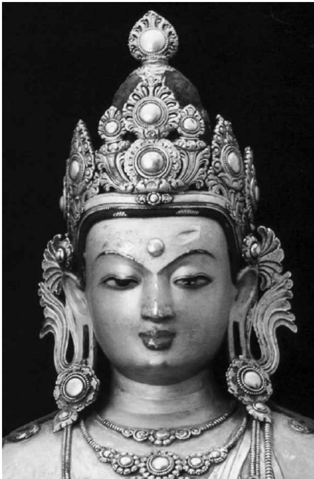
Будда. XVII в. Улан-Батор, Музей изобразительных искусств

Но почему мы говорим о «мнимых атеистах»?