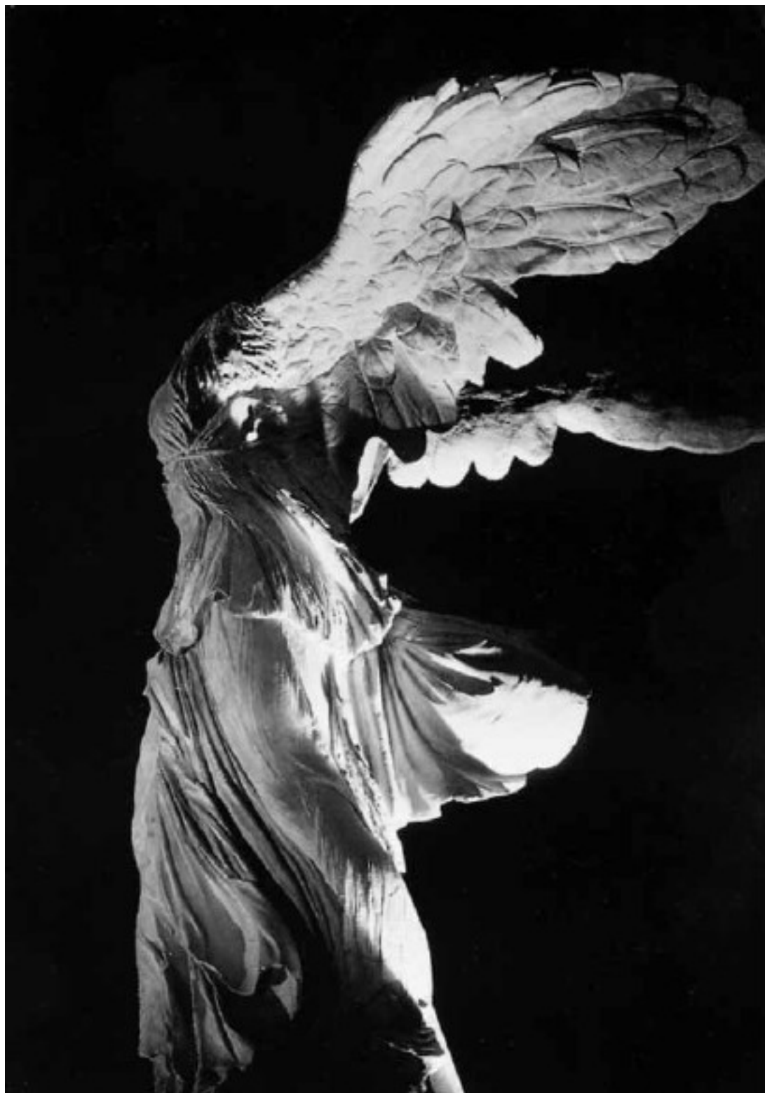
Ника Самофракийская. Ок. 190 г. до н. э. Париж, Лувр

Мы нуждаемся в новой науке, которая не будет служить искусственно созданным интересам и оправдывать насилие. Нам нужно новое искусство, которое даст нам возможность снова соединиться с Прекрасным, искусство, основанное не на тоске и беспокойстве, а на подлинном исследовании. Нам нужна новая политика, которая приведет людей к сосуществованию и благородству, а не к столкновениям и безответственному сожигательству. И нам нужен новый мир. Но этот мир уже существует – это все та же Вселенная. Это природа. Главное, что нам