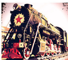
Поезд на запад

Успешно выдержав бой с «окопавшимися тыловыми крысами» в администрации вокзала, он получил посадочные билеты на поезд и все поехали домой.