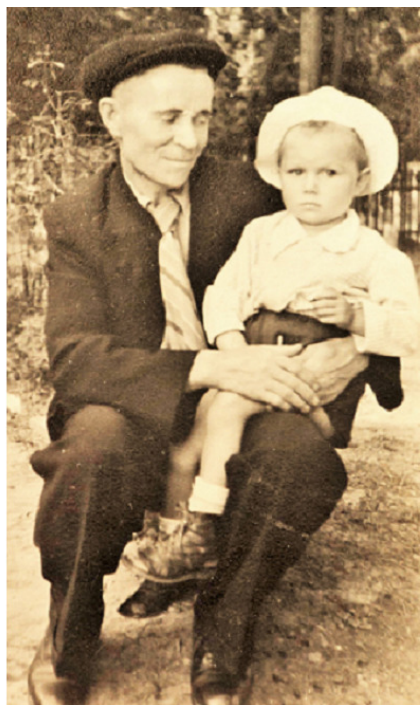
Фото 1949 г.

Во время войны на завод упало несколько снарядов. Отец занимался восстановительными работами. Затем был назначен начальником крупного производственного цеха, в котором проработал до пенсии. Прожил 80 лет. Благодаря ему мы с сестрой получили высшее образование. У нас родились дети, внуки и правнуки.