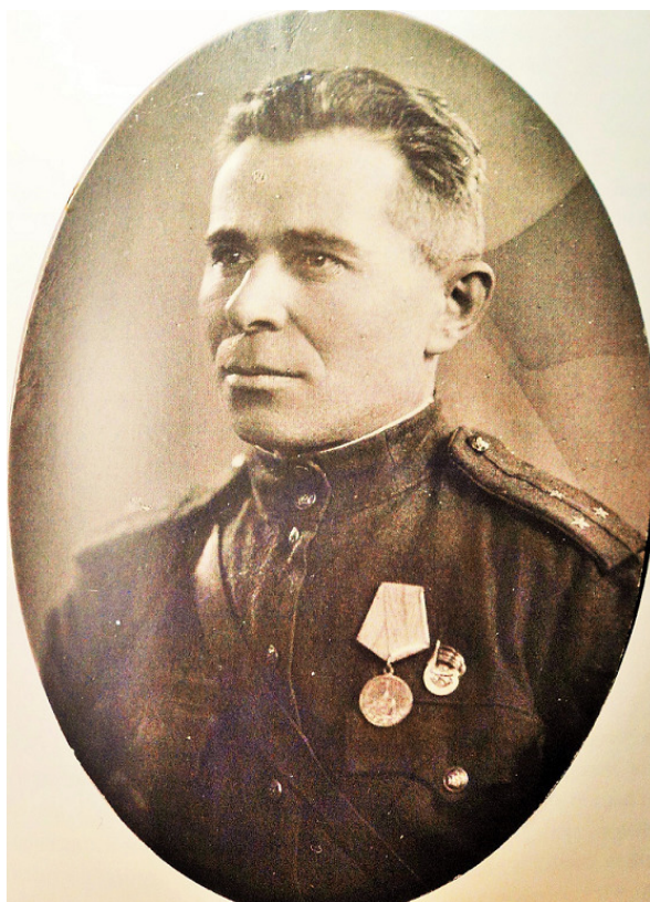
Фото 1943 г.

В апреле 1943 года под Псковом – третье ранение. На подступах к селу Богданово наступающая пехота заняла немецкие окопы. Враг готовил контратаку. Для встречи немцев нужен был пулемёт. Ближайший станковый пулемёт занимал позицию в стороне от предполагаемого направления атаки под нашим подбитым танком. Расчёту было приказано сменить позицию. Надо было продвинуться на расстояние не более 50 метров. Но немцы заметили манёвр и открыли пулемётный огонь. Оба солдата были убиты. Тогда отец сам решил дотащить «Максим». Через несколько прыжков он оказался у пулемёта, который весил 65 килограммов. Было очень грязно и скользко