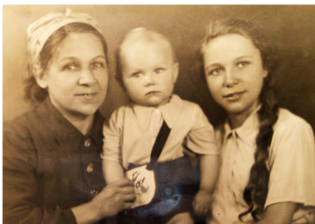
Фото 1948 г. Ленинград. Мама, сын и дочь. Фотографировал папа.

По записи в маминой трудовой книжке можно установить дату отъезда в Ленинград: 22 сентября 1945 года.