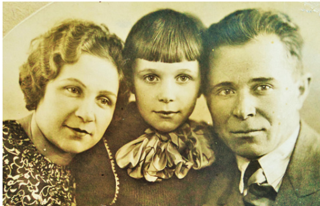
Фото 1940 г.

4 июля 1941 года отец записался в народное ополчение. Дома остались жена и маленькая дочь