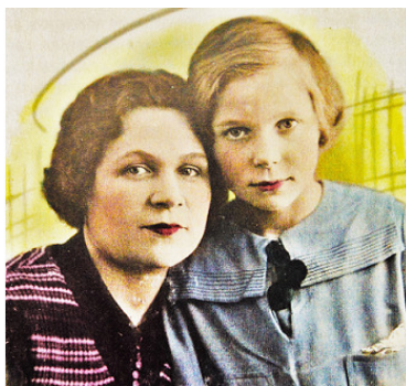
Фото 1941 г. Казань