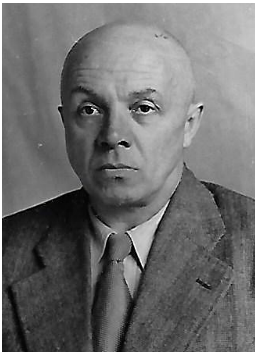
Леонид Львович Кербер