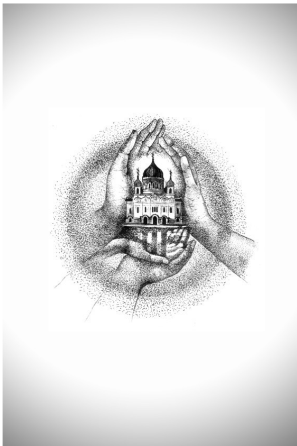
Пасхальное А. Решетников